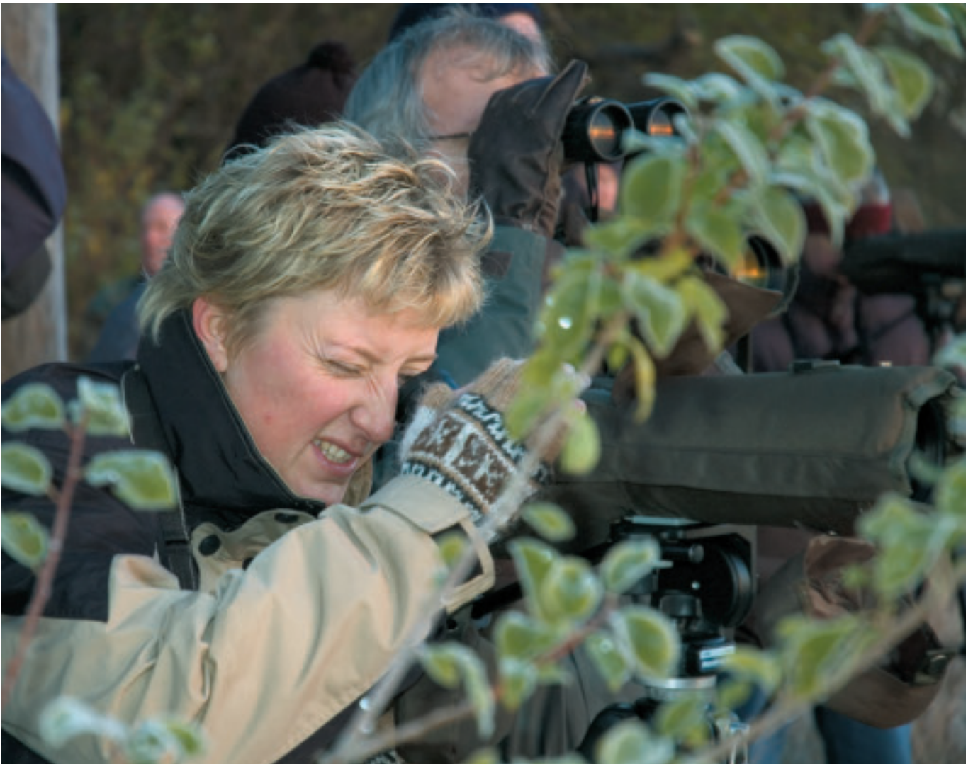
Det er lettere at få frivillige til feltarbejdet end til det organisatoriske arbejde.

Naturbeskyttelsesloven fik et helt nyt kapitel 2a om international naturbeskyttelsesområder. Regeringen har forstået signalerne fra EU. Samlet set kan det give en tiltrængt beskyttelse af alle Natura 2000-områder; men det kræver penge - ca. 250 mio. kr. pr år i 10 år - til aflysning af de skadelige aktiviteter, der foregår i naturområderne og deres nærmeste omgivelser.