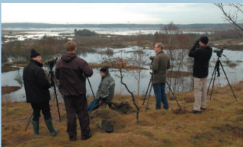
Caretakere ved Bolling Sø.

Der var mange nye ansigter blandt de deltagende caretakere. Ofte er det medlemmer, der har fået mere fritid efter et aktivt arbejdsliv og nu gerne vil gøre noget for fuglesagen. Mødet styrkede helt sikkert korpsånden, og som én sagde ved afslutningen af seminaret: "Nu skal jeg rigtig hjem og tælle - og passe mine områder, for jeg jo en del af en stærk bevægelse". Hans ord udtrykker præcist, hvad der er DOF's styrke.