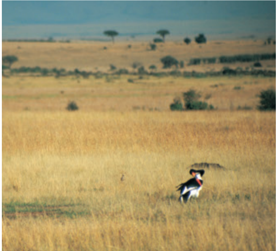
Sadelnæb på Masai Mara Sletten i Kenya.

Der blev i det forgangne år indledt et samarbejde med Care Danmark, WWF