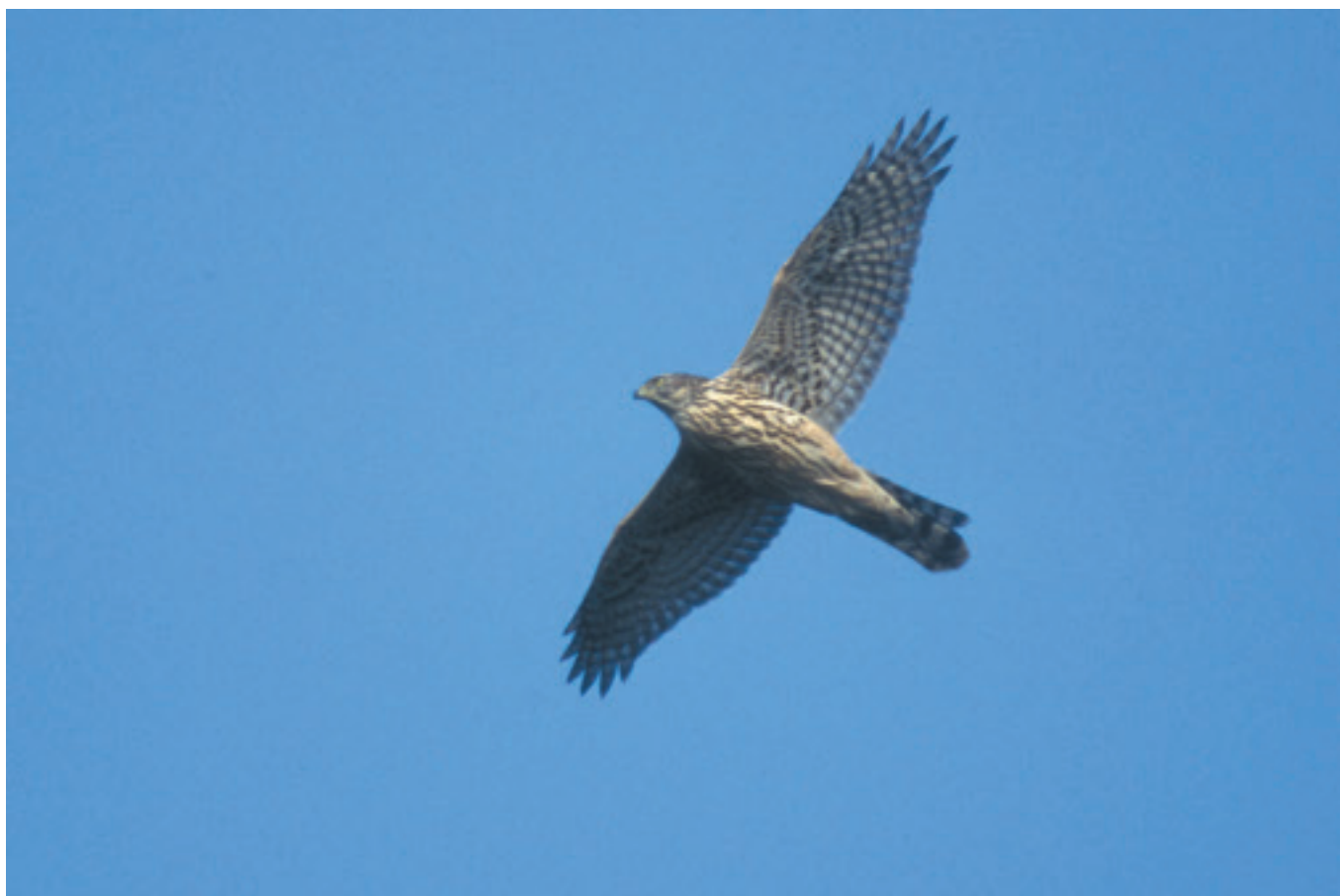
Ministeraftalen gavner Duehøgen.