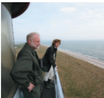
Miljøminister Connie Hedegaard ser på fugle fra fjret på Hyllekrogtangen.

Ved det efterfølgende møde i huset på Hyllekrog kunne begge parter, miljøministeren og DOF konstatere, at aftalen virker, efterleves og følges op på flotteste vis. Miljøministeren havde i marts 2005 udsendt en forvaltningsplan for engfugle, en kampagne for beskyttelse af danske rovfugle var under planlægning og blev senere fulgt op af en flot og ambitiøs national handlingsplan for Rød Glente. Med Rød Glente som løftestang forventer vi, at myndighederne nu for alvor bistår DOF med at komme de alvorlige problemer med ulovlig rovfuglebekæmpelse til livs. Stort set alle steder er der fin kontakt mellem skovdistrikterne og DOF, den økonomiske støtte til DOF til overvågning af Hedehøg og til vores almindelige fugleovervågning falder prompte, og DOF har hjulpet DMU med vigtige data til en revision af rødlisten og udpegningsgrundlaget for danske fuglebeskyttelsesområder. Connie Hedegaard stillede i udsigt, at en ny treårig ministeraftale kunne underskrives ved DOFs jubilæum i oktober 2006. En vellykket dag sluttede med stor begej-