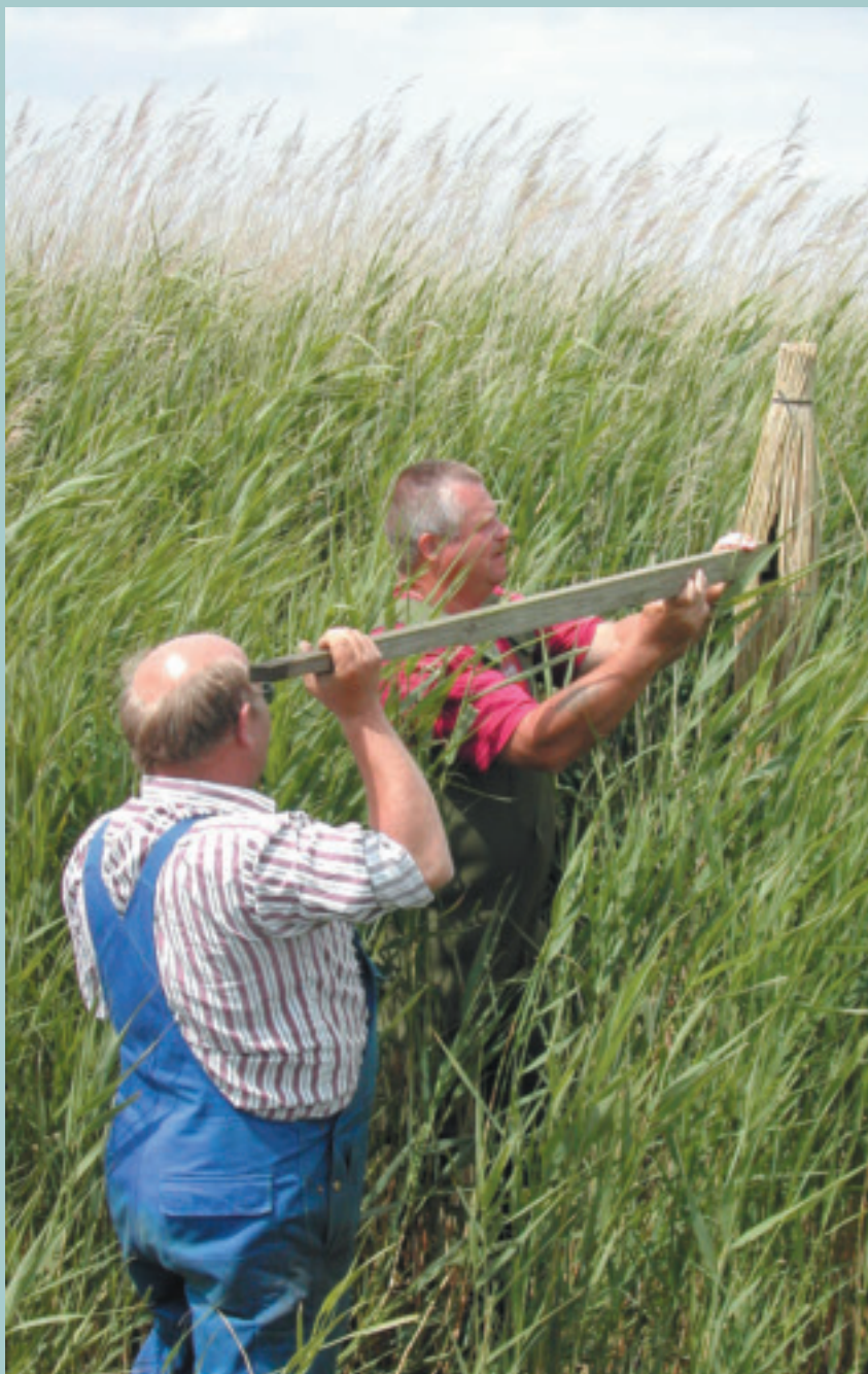
Skægmejsere der opsættes i Tryggelev Nor.

Den nye kommunalreform, der fastsætter et meget mindre antal kommuner, som til gengæld vil få tillagt mange af de nedlagte amters miljø- og naturopgaver, var den egentlig anledning til, at DOF satte dette udviklingsarbejde i gang. Ved samme lejlighed kunne der sættes fokus på behovet for en større medlemsinddragelse i foreningens beslutningsprocesser bl.a. gennem en modernisering af lovene. Efter en længevarende høringsproces i lokalafdelingerne, både i bestyrelse og blandt almindelige medlemmer, kunne HB i efteråret gennemgå de indkomne svar og konstatere, at der ikke var ønsker om store ændringer. Det valgte vi at tolke som tilfredshed med den måde, foreningen drives på. HB foreslog repræsentantskabet oprettelse af en ny lokalafdeling i Nordsjælland og ellers nogle mindre justeringer af grænserne mellem de enkelte lokalafdelinger, affødt af nye kommunegrænser, der nogle steder bevæger sig på begge sider af en amtsgrænse. Repræsentantskabet tog pænt