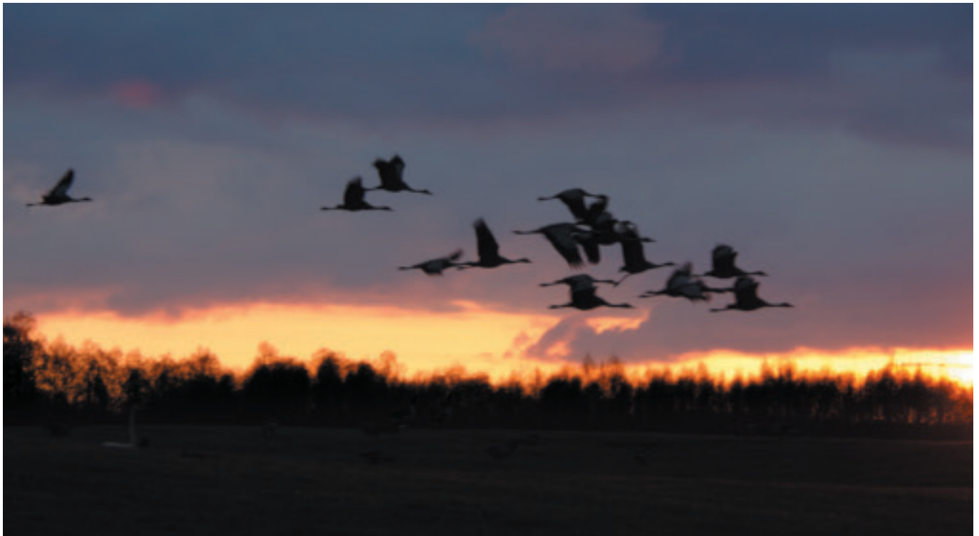
Tranen fortsætter sin fremgang i Danmark med 58-66 ynglepar i 2005.