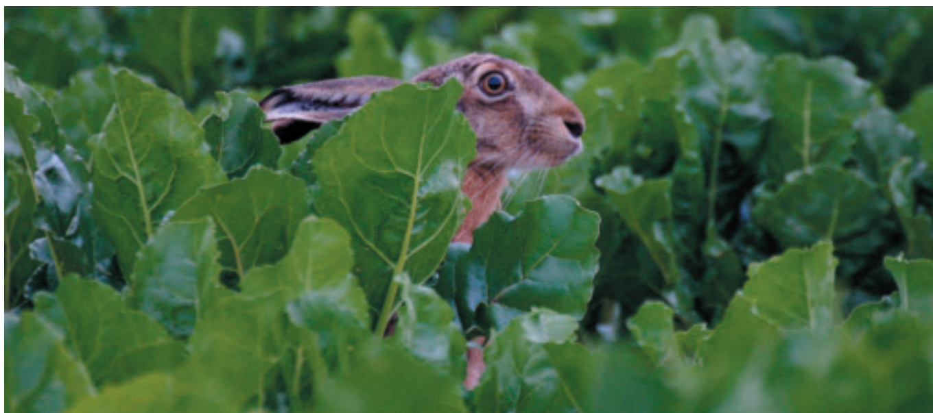
Ikke kun fuglene vil have gæde af DOF's forslag til brug af landdistriktsmidlerne.