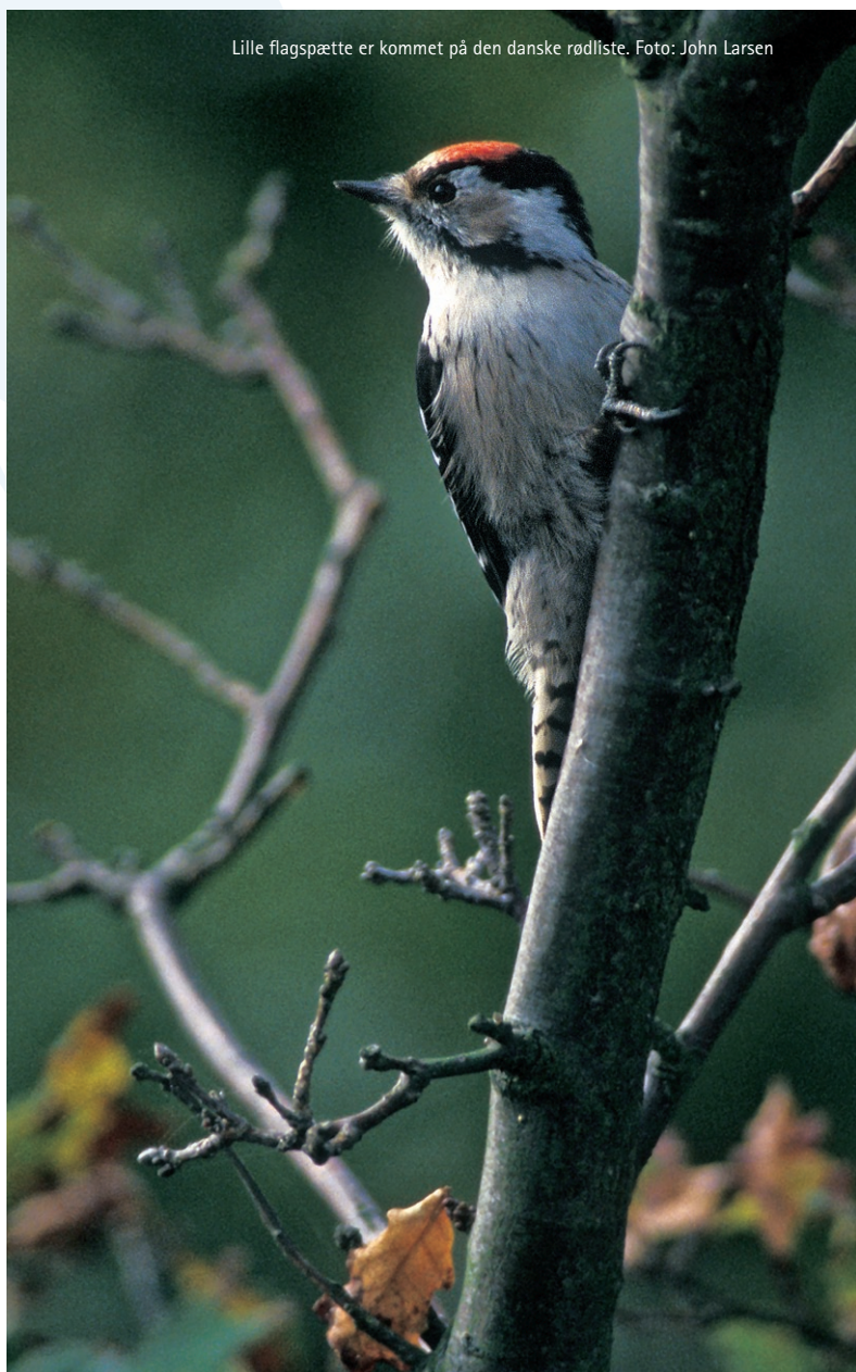
Lille flagspætte er kommet på den danske rødliste.

På trods af de forholdsvis mange projektaktiviteter, skal det ikke være nogen hemmelighed, at DOF i stigende grad har fundet det vanskeligt at finde en balance mellem de mål, vi forfølger som naturbeskyttelsesorganisation, og DANIDA's ganske restriktive krav om, at fattigdomsbekæmpelse er den altoverskyggende målsætning for udviklingsprojekter. 2007 bliver derfor afgørende for, om DOF skal fortsætte med sine internationale projektaktiviteter, eller om vi alene skal koncentrere os om politiske og medlemsrettede aktiviteter på det internationale område.