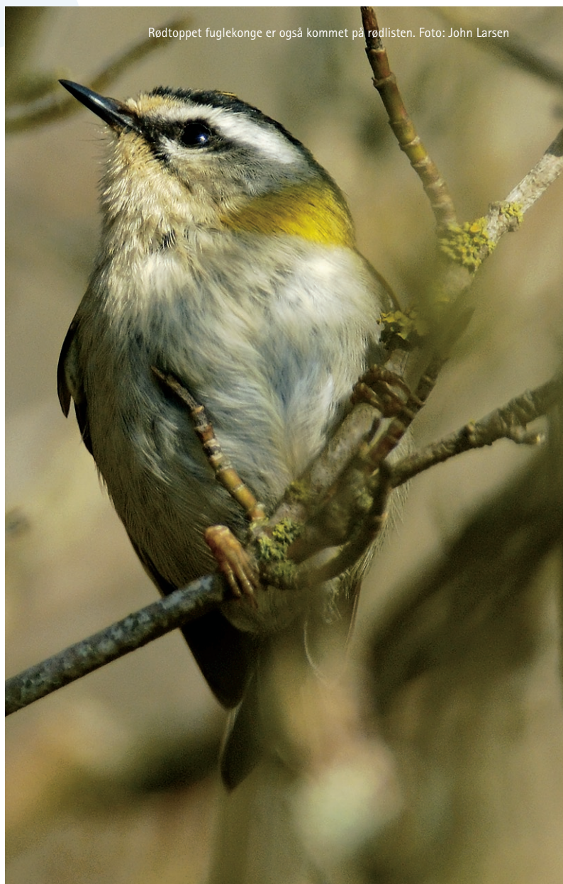
Rødtoppet fuglekonge er også kommet på rødlisten.