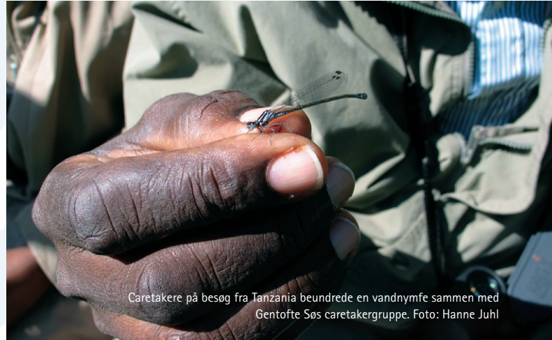
Caretakere på besøg fra Tanzania beundrede en vandnymfe sammen med Gentofte Søes caretakergruppe.

Næsten alle steder er der etableret en god dialog mellem skovdistriktet og DOFs lokalafdeling. Styrelsen har på statens egne arealer meget fint udmøntet anbefalingerne om engfuglevenlig pleje, som beskrevet i deres egen handlingsplan. Dertil kommer, at Styrelsen fra Life-programmet har