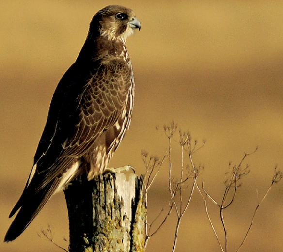
Ung jagtfalk på Fugleværnsfondens reservat på Nyord.