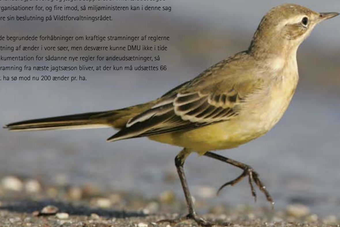
Gul vipstjert er en af de afrikatrækkende arter, hvis bestand går tilbage

Samarbejdet – nu på fjerde år – mellem Miljøministeriet og DOF fungerer særdeles tilfredsstillende. Ved 3-4 årlige møder mellem repræsentanter fra ministeriet og DOF sikres, at der er fremdrift på alle områder i aftalen. I 2007 er der bl.a. sikret midler til overvågning af hedehøg og til afværgelse af høst af reder i risikozonen, og den nationale Handlungsplan for truede engfugle følges tæt af en særlig engfuglearbejdsgruppe.