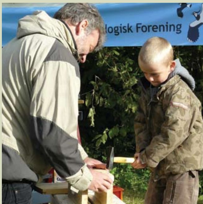
Et af de offentlige arrangementer, DOF deltager i, er Kongskildemarkedet ved Sorø. Her kan publikum blandt andet lave redekasser med ekspertbistand.

En anden årsag til den store nettotilgang af medlemmer er, at det er lykkedes at sænke frafaldsprocenten fra 12 % til 8 % over de seneste 4 år.