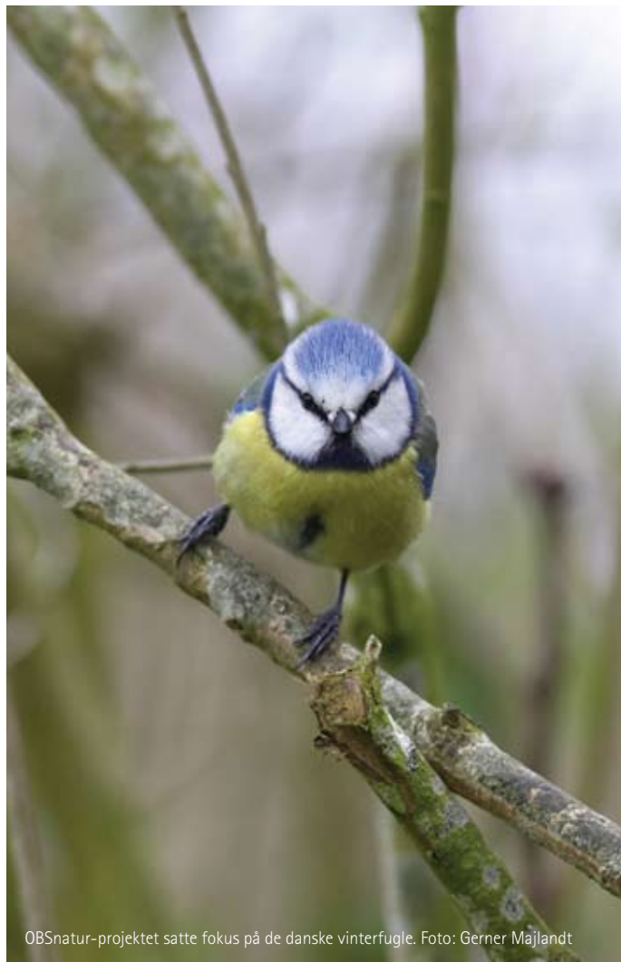
OBSnatur-projektet satte fokus på de danske vinterfugle.

I klimaændringernes lange tidsperspektiv er det vigtigt at have fokus på udfordringerne i vores egen tid. Vi skal kæmpe hårdere end nogensinde for fuglenes 'overlevelsessteder' både nationalt og internationalt. Det har vi også gjort i 2007 ved at sætte fokus på de mange naturpolitiske udfordringer, vi stadig står overfor.