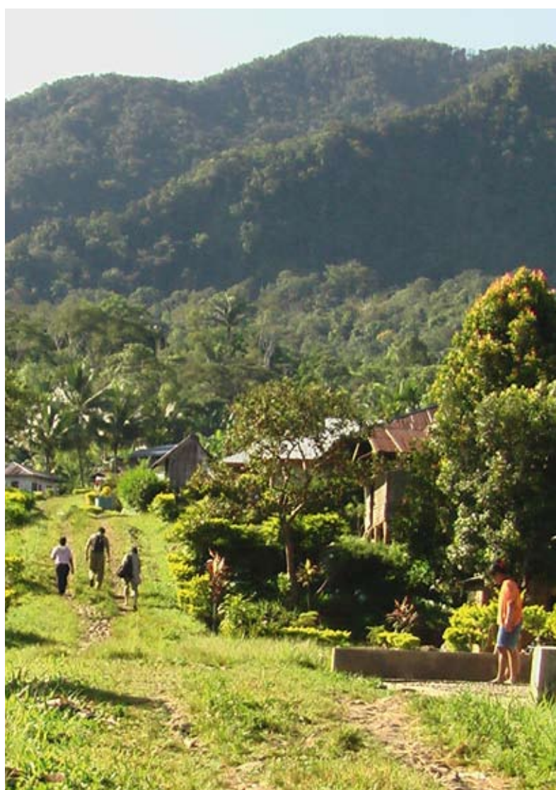
På den indonesiske ø Flores laver DOF et naturbeskyttelsesprojekt for 24 landsbyer rundt om bjerget Mbeliling.

Projektet bliver lavet i samarbejde med lokale NGO'er og BirdLife Indonesia, som DOF også har samarbejdet med i det meget succesrige projekt på Sumba, og som skal træne landsbyernes beboere i bæredygtigt landbrug.