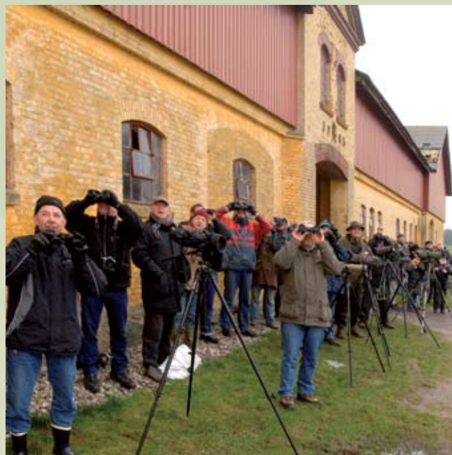
Ørnens Dag i februar trækker presse og publikum til over hele landet. Her ved Brændgårdssøen på Fyn.