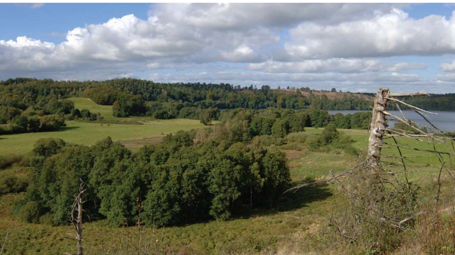
DOF vil have flere fuglebeskyttelsesområder udpeget som levesteder for bl.a. rød glente.

Kommissionen har i øvrigt meddelt DOF, at vores konkrete klage fra 2002 over den danske stats forvaltning af Tøndermarskens fugle indgår i den omtalte åbningsskrivelse.