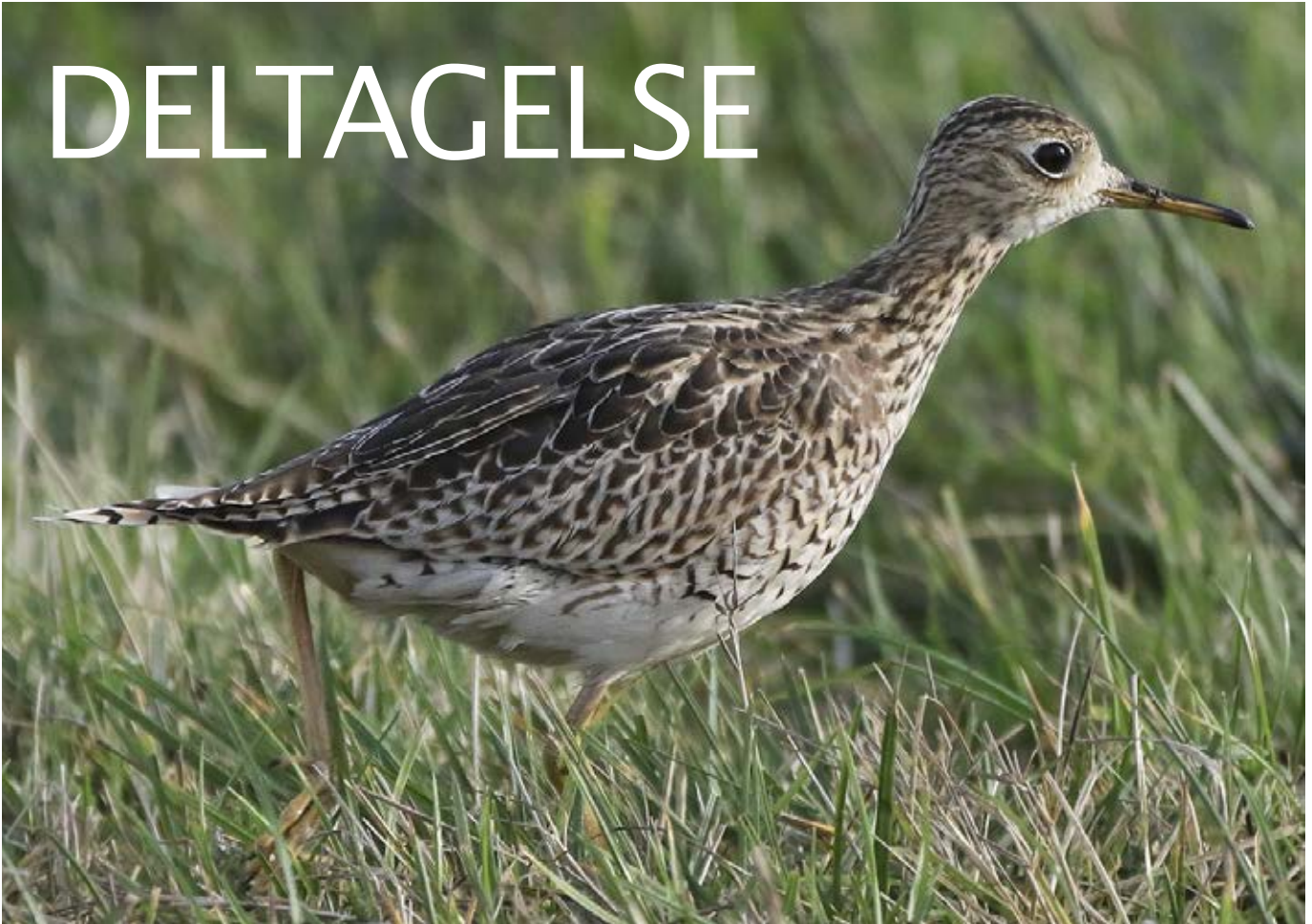
Bartramsklireen sås af mange begejstrede fuglekiggere.