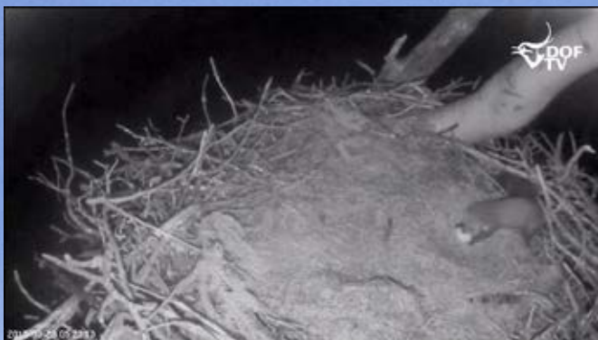
DOF's kamera ved en havørnerede fangede husmår som æggerøver.