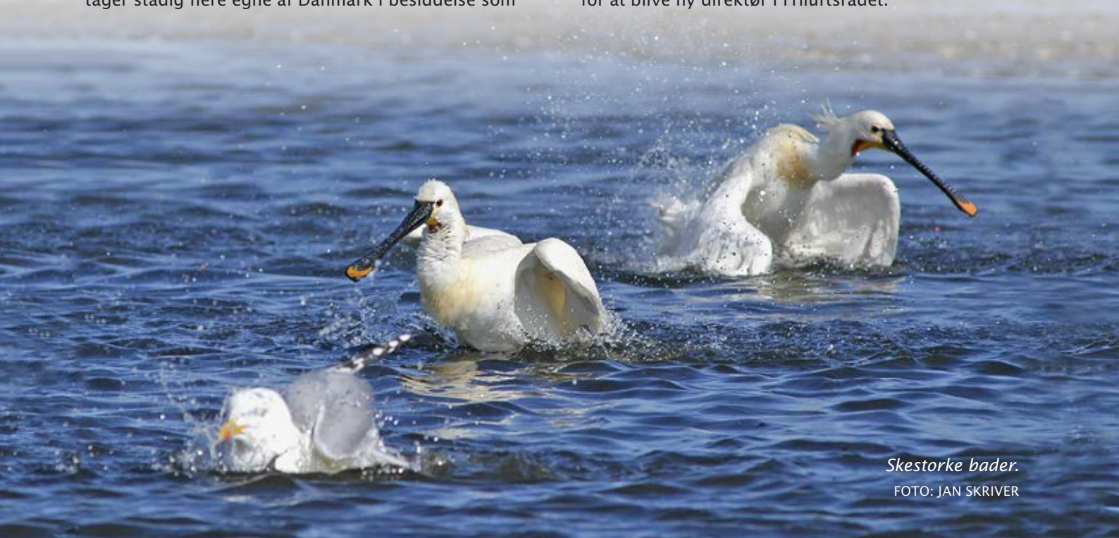
Skestorke bader.