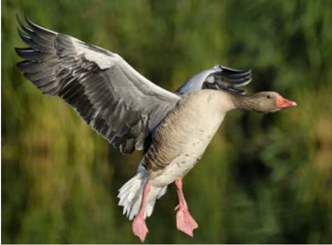
Grågås yngler flere steder og mere spredt over landet end tidligere, viser data fra Atlas III.