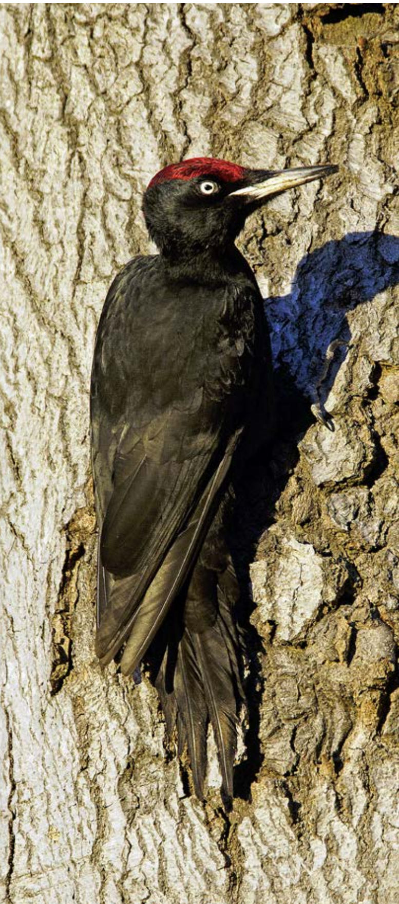
Sortspætters redetræer blev fældet ulovligt i Gribskov, og DOF gik ind i sagen for at forhindre gentagelser.