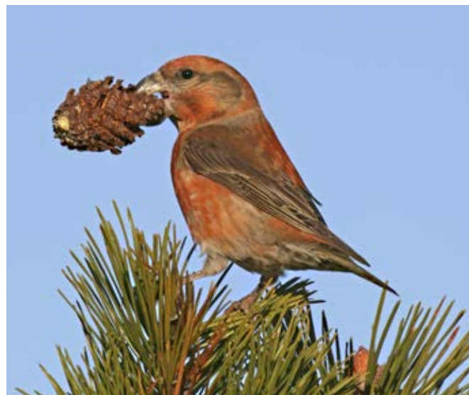
Stor korsnæb er en af de 15 arter, der nu yngler flere steder, viser data indsamlet under Atlas III.

De to første sæsoner har opfyldt målsætningen, idet TimeTælleTure ne i yngletiden nu er udført i 40 procent og om vinteren i 52 procent af kvadraterne.