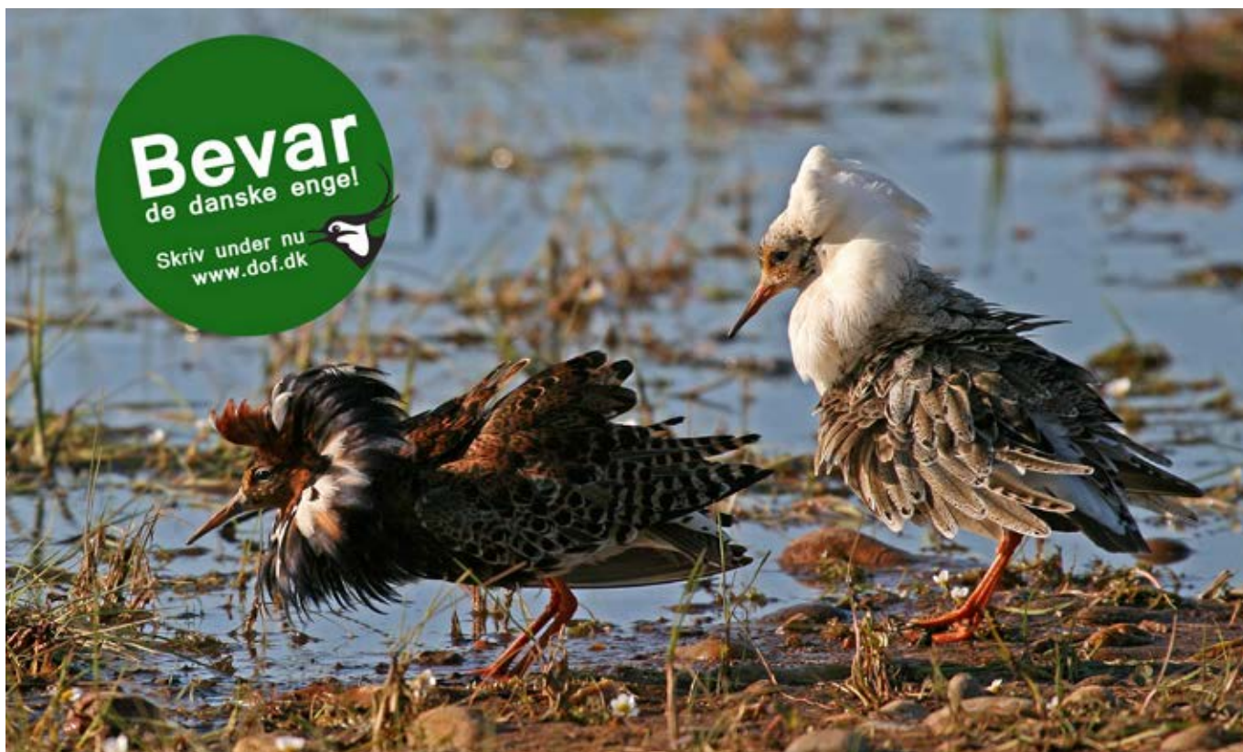
Brushane var en af de engfugle-arter, som DOF ønskede at hjælpe med kampagnen "Bevar de danske enge".