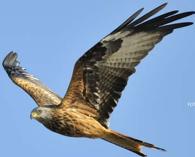
Rød glente.