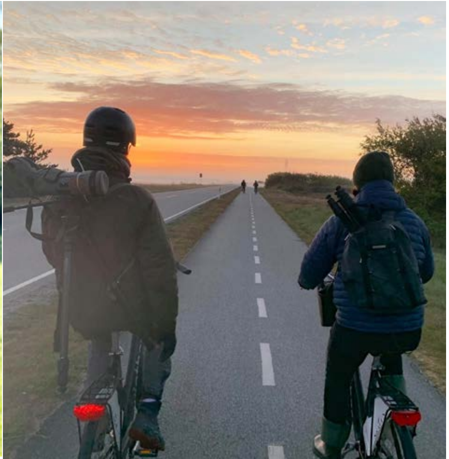
DOF UNG på vej på morgenobs i Blåvand.