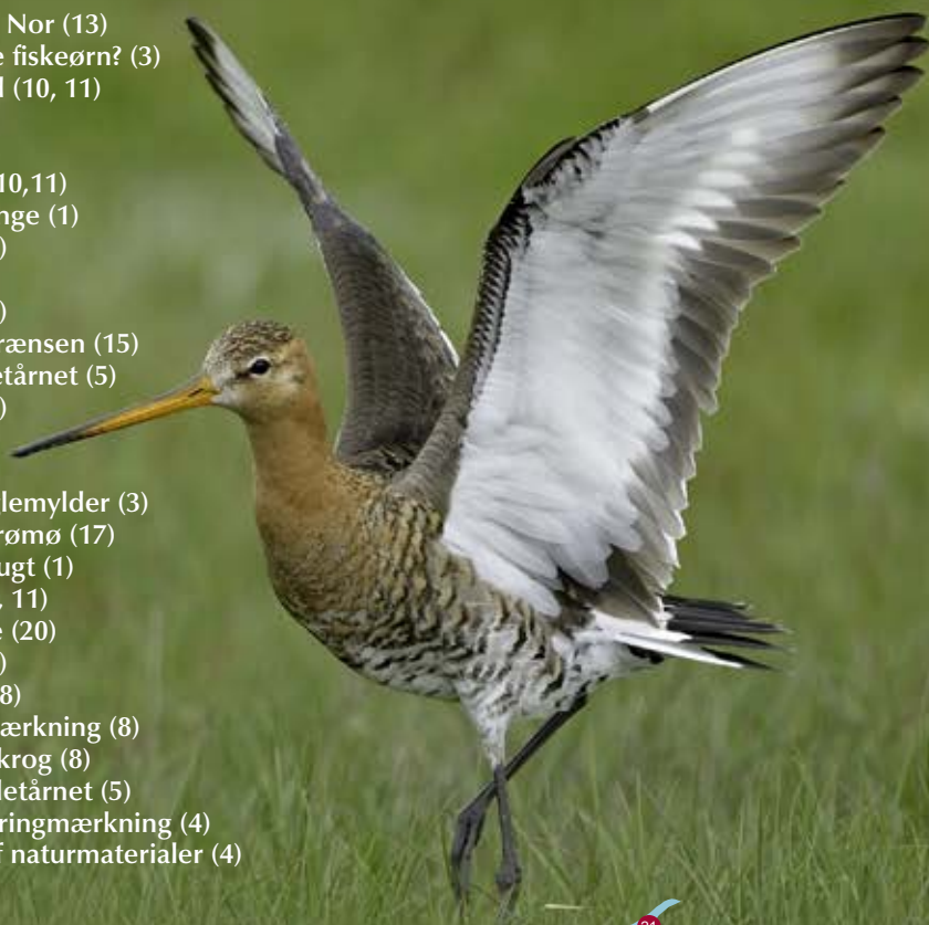
Stor kobbersneppe

Vesterbrogade 140 • 1620 København V • Tlf. 3328 3839 • Mail: fvf@fuglevaernsfonden.dk