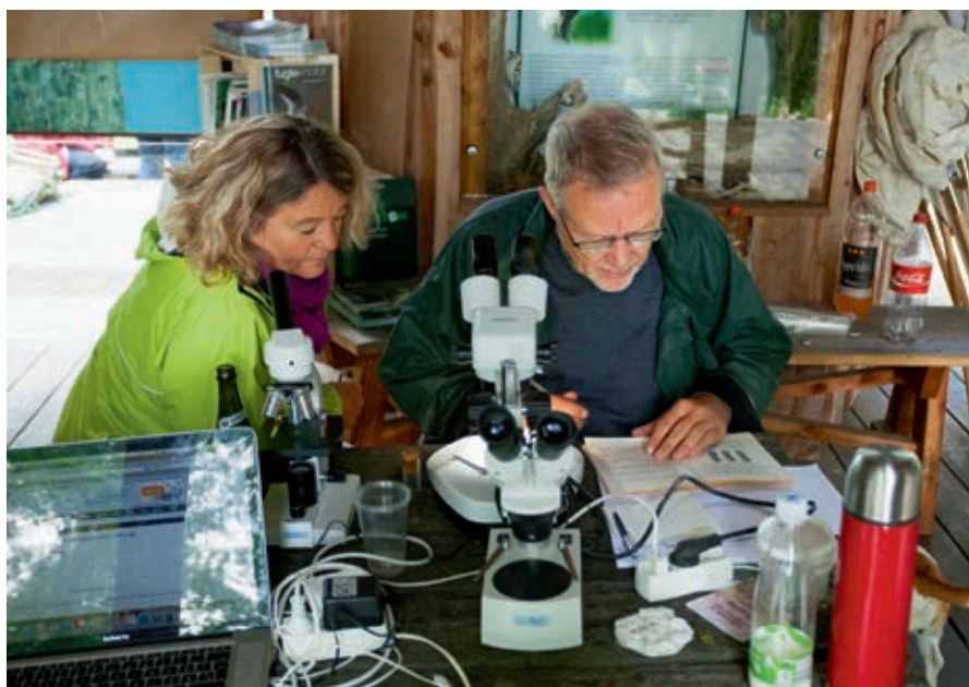
Fra en bioblitz i Vaserne.

at man nu ofte kun ser de hårdføre elletræer vokse i smalle bæltter langs søer og vandløb. Siden 1940'erne har ellesumpen ved Vaserne dog stort set fået lov til at passe sig selv, og mange af træerne har nu en alder, som gør, at de er særligt interessante for hulerugende fugle som spætter og mejser. Om vinteren trækker ellesumpen også mange fugle til. Grøn- og gråsisken ses ofte i elletræets yderste grene på jagt efter ellekoglernes frø. I kolde vintre, hvor Furesø fryser til is, kan man opleve vandriksen forlade rørskovens skjul og søge føde helt tæt på stierne.