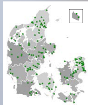
Kortet viser fordelingen af de 155 nye tidlige punkt-tællinger.