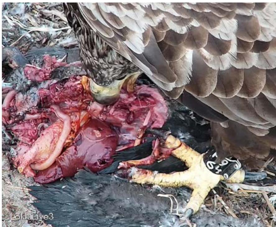
På dette billede fra et webcam er en yngre ringmærket havørn i gang med at fortære en af skarvungerne. Der var omkring 200 forskellige havørne i området.

På Saltholm ynglede der i en længere årrække mange skarver på jorden, men efter at være blevet 'plaget' af unge havørne år efter år, flyttede skarverne til nabøen