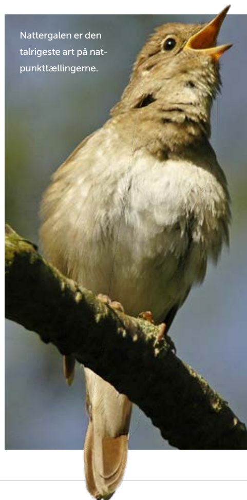
Nattergalen er den talrigeste art på nat-punkttællingerne.

Hvordan er det så gået med disse nye tællinger? Af tidlige yngletidstællinger er der i skrivende stund (medio juli) indkommet 155 stk., ret jævnt fordelt over hele landet (se kortet side 14). Dette antal kan sammenlignes med, at der lige nu er rapporteret 399 stk. af de traditionelle punkttællinger i den sene yngletid (1. maj-15. juni). Erfaringsvis kan der