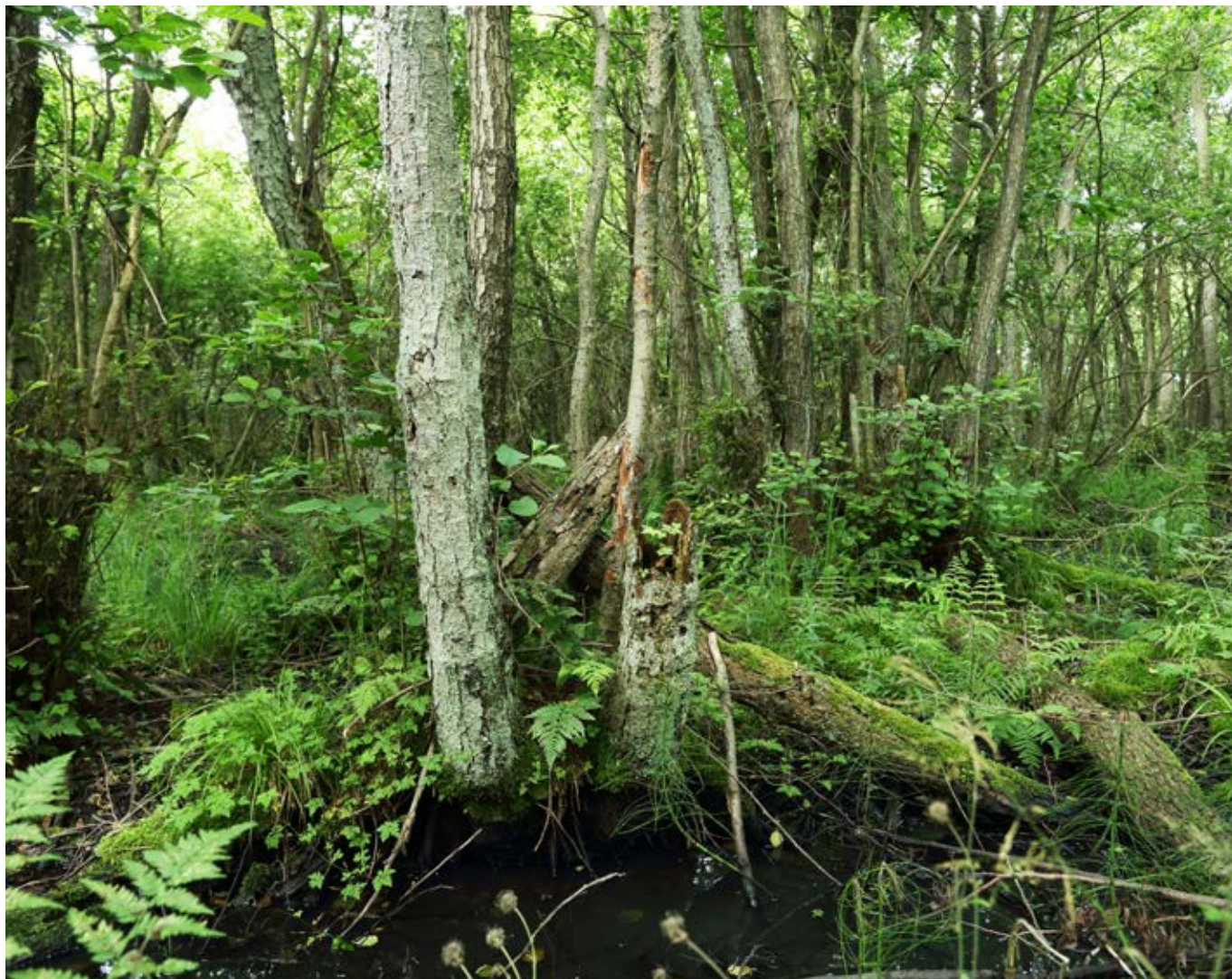
Ellesumpen er Danmarks ferske mangrove, hvor rødellen dominerer i det næringsrige og våde miljø. Der er flest ellesumpe i den østlige del af Danmark, og i Vaserne kan man tørskoet tage på opdagelse i sumpskoven.