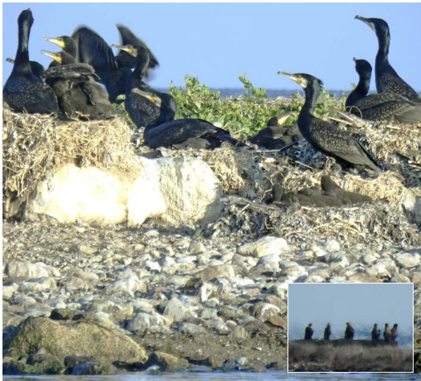
Fra skarvkolonien på Græsholm ved Bredholm i det Sydfynske Øhav. Rederne er anlagt direkte på kysten. Unger og gamle fugle er udsat for prædation fra havørnene i området. Indsat: Seks havørne hviler sig på vandingsstrug på den nærliggende Bredholm.

samarbejde kan være helt afgørende for gennemførelsen af en så stor og ambitiøs opgave. Det har samtidig glædet os, at en håndfuld af ornitologerne fra 1970'erne efter næsten 50 år atter har stillet sig til rådighed i den nye ø-undersøgelse, og ofte til de samme øer.