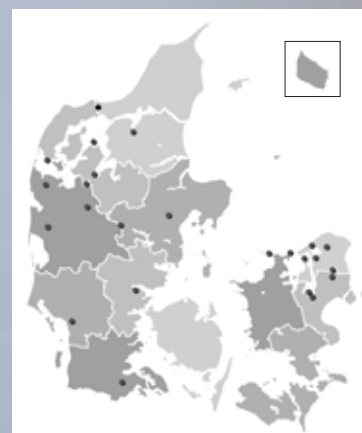
Kortet viser fordelingen af de 28 nye nat-punkttællinger.

Musvitten er den art, som er registreret på flest af de nye tidlige punkttællings-ruter. Ved de sene tællinger er arten kun nummer seks.