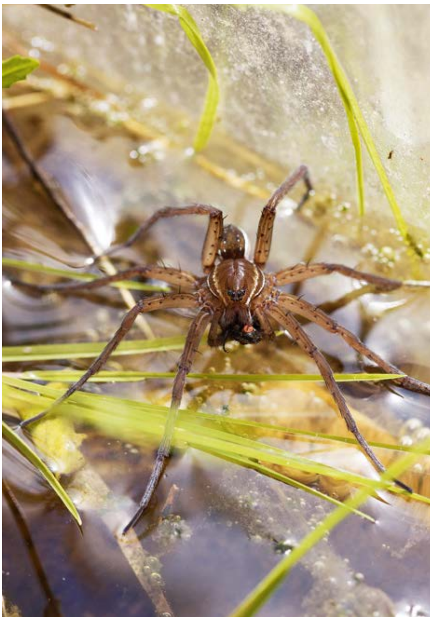
Rovedderkoppen dolomedes planetarius .

tørvegravningens ophør, har der indfundet sig et spændende dyre- og planteliv med arter som bl.a. lys-skivevandkalv og stor kærguldsmed, der både er sjældne og beskyttet af EU-habitatdirektivet. I flere af tørvegravene lever også stor rovedderkop, dolomedes , som er vores største edderkop. Edderkoppen er i stand til at fange fisk, der vejer 4-5 gange så meget som den selv. Når edderkoppen er på jagt, sidder den ved søbreden med de forreste ben på vandet. De fine hår på edderkoppens ben kan mærke selv små vibrationer på eller under vandoverfladen, og på den måde kan den lynhurtigt gribe en lille fisk lige under vandoverfladen eller et insekt, som er nødlandet på vandet.