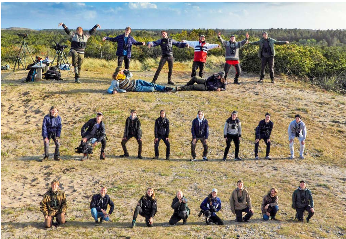
Holdfoto i Coronaventlig opstilling på DOF UNG's velbesøgte lejr i Skagen i foråret 2021.