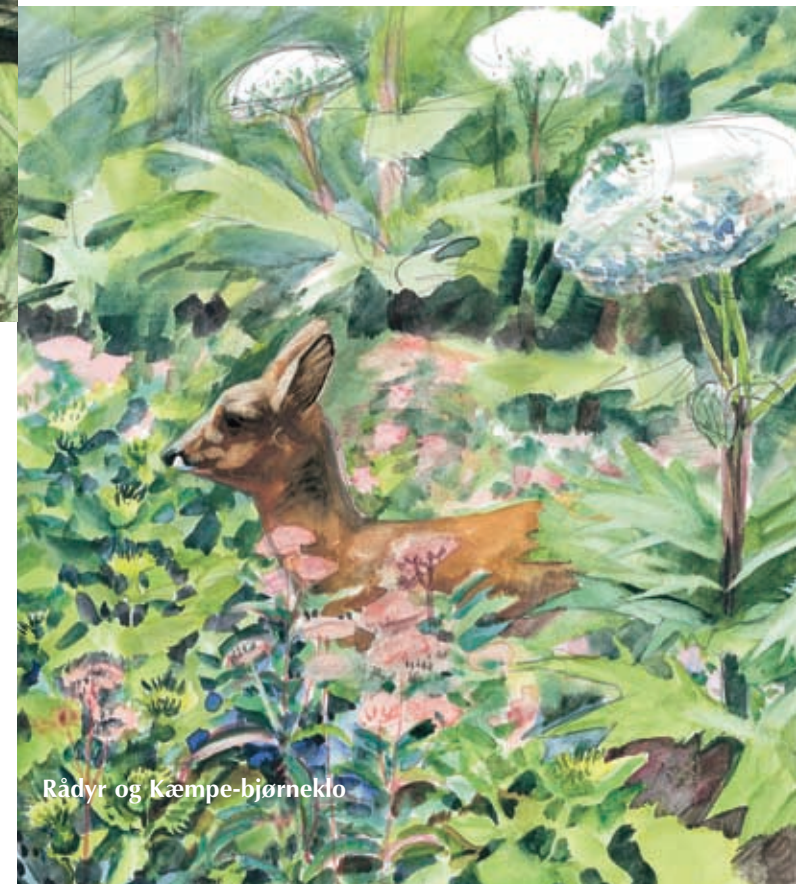
Rådyr og Kæmpe-bjørneklo

I Vaserne bekæmpes kæmpe-bjørneklo ved hjælp af fåregræsning og håndkraft. Det er en lang og sej kamp, for når planten først har fået fat, er den svær at komme til livs. Én plante kan bære op til 50.000 frø, som kan overleve i jorden i op til 10 år og så er den tilmed giftig.