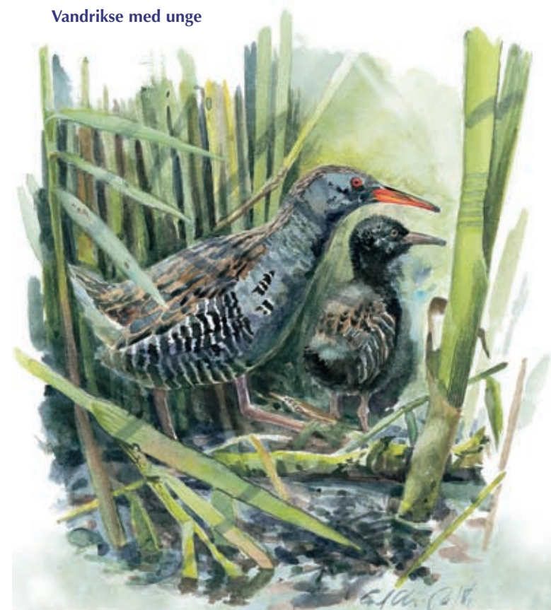
Vandrikse med unge