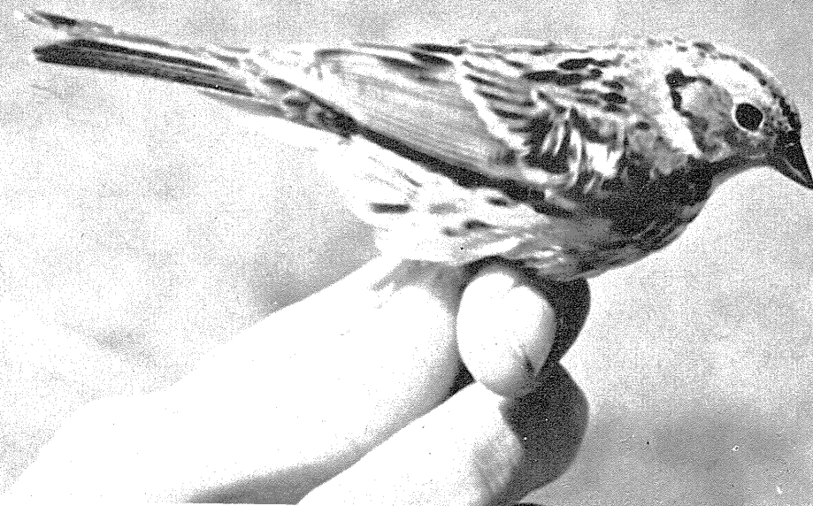
Fig. 4. Dværgværpling Emberiza pusilla , 17. maj 1973, Tipperne. Little Bunting Emberiza pusilla , 17th May, 1973, Tipperne, West Jutland.

Fjordterne Sterna hirundo 1972: 24.6., Streymoy Færøerne, flere ex., det ene findes på Zoologisk Museum i København, Jan Dyck. Første forekomst på Færøerne, se FO (1973) 15: 72-73.