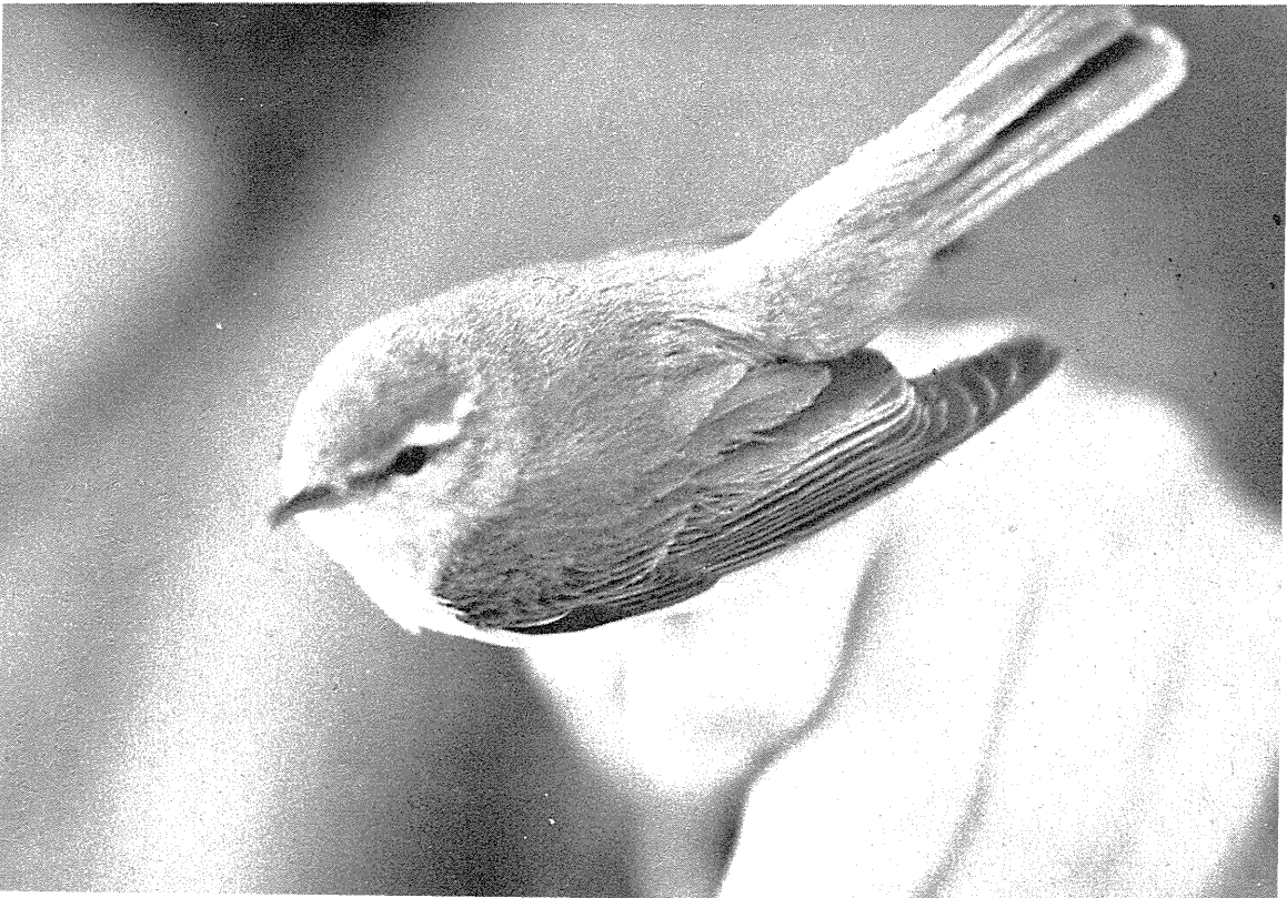
Fig. 2. Nordsanger Phylloscopus borealis , 22. maj 1968, Kongelunden, Amager. Den forringede billedkvalitet skyldes, at billedet er reproduceret efter et farvebillede. Foto John Sandberg. Arctic Warbler Phylloscopus borealis , 22nd May, 1968, Amager. The picture has been made from a colour transparency.

Er hermed udgået af listen. Forveksling med ad. af nominatracen er næppe mulig, og ♀ og juv. af de to racer kan ikke skelnes i felten. Udvalget har i tidens løb kun haft 8 forelagt, 4 fra april og 4 fra maj, og de blev alle godkendt. Racen kan ikke siges at være årligt forekommende i Danmark.