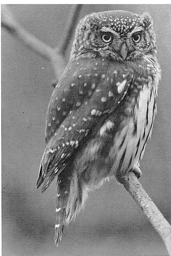
Fig. 3. Spurveuglen optrådte invasionsagtigt i vinteren 74/75, dog var den i Danmark fåtallig i forhold til Skåne.

1973: 31.5.-4.6., Christiansø (B), 6-8 stk. set i løbet af perioden og hørt syngende, heraf 1 fanget og ringmærket, N.E.