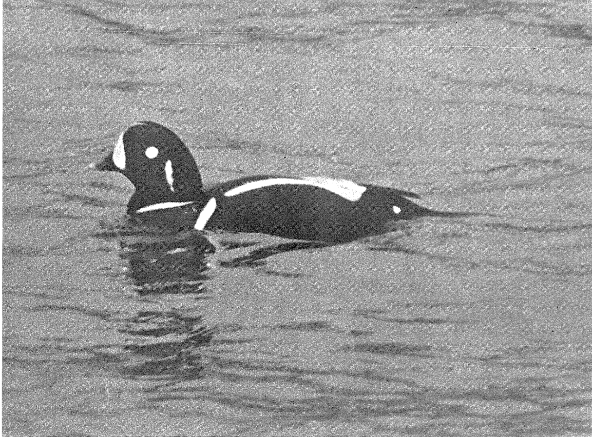
Fig. 4. Strømanden fra Thorshavn, den 1. marts 1972. The Harlequin Duck Histrionicus histrionicus from the Faeroes, 1st March 1972.

stiansø 2. - 18. maj. I maj 73 blev den også iagttaget på Uttklippan ved Blekinges sydkyst (altså ikke langt fra Christiansø). Fra Ottenby på Øland har der været 4 i maj-juni siden 1961. Alle disse forekomster om foråret ved Østersøen tyder på, at det har været fugle af den bøhmiske bestand, som er trækfugle, mens arten er standfugl i Alperne.