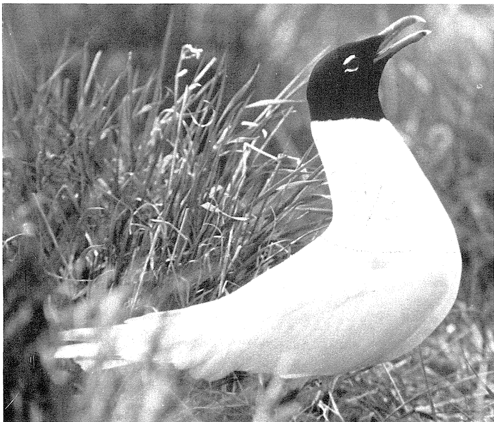
Fig. 2. Sorthovedet Måge Larus melanocephalus , Hjelm den 8. maj 1975. Mediterranean Gull Larus melanocephalus , Hjelm Island (East Jutland), 8th May 1975.