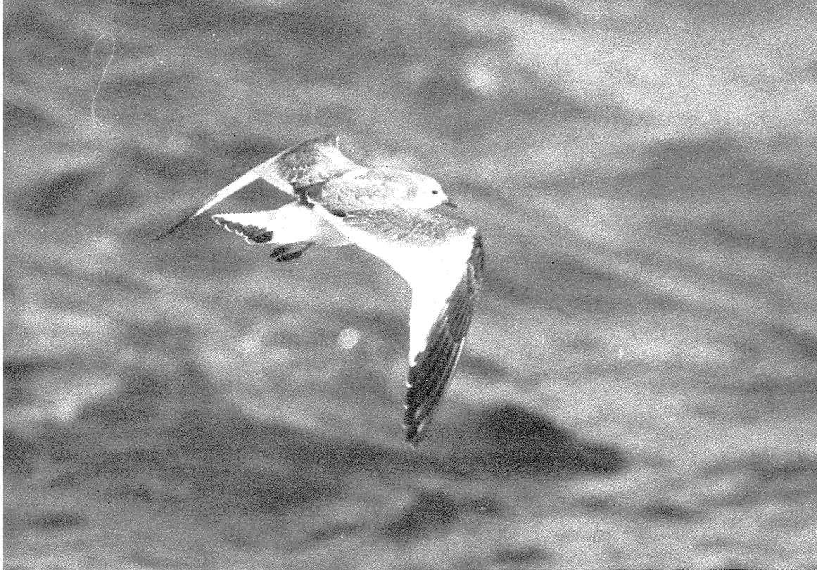
Fig. 3. Ung Sabinemåge Xema sabini , Hanstholm den 23. oktober 1975. Juvenile Sabine's Gull Xema sabini, Hanstholm (NW Jutland), 23rd October 1975.

1975: 27.4.-12.5., Hjelm (ØJ), ad., Kjeld Hansen (se fig. 2).