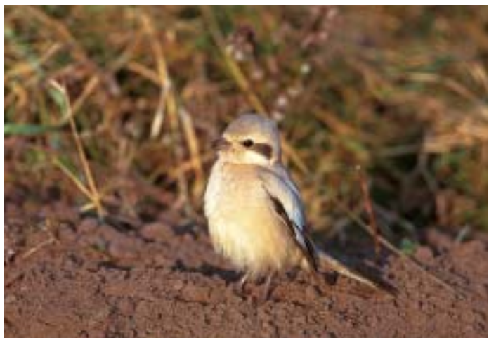
Steppeørnskade 1K, Skagen 26. november 1997.

Den officielle danske liste udgøres herefter af arterne i kategori A, B og C. Fund af arter i kategori D og E behandles også af SU, men publiceres særskilt bagest i SU-rapporterne.