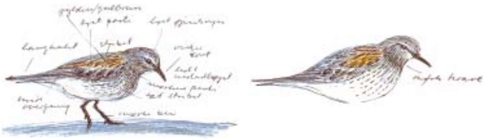
Hvidrygget Ryle ad., Ulfshale, Møn 27. maj 1997. Tegning: Niels Peter Andreasen.

Sydlig Blåhals, Hvidhalset Fluesnapper og Krognæb. For disse arter gælder derfor indtil videre den hidtil anvendte opsummering, hvor der skelnes mellem fund før 1.1 1965 (første tal i opsummeringen) og efter 1.1 1965 (andet tal i opsummeringen). Bemærk i øvrigt, at antal fund ikke altid er identisk med antal individer, idet flokke og par regnes som enkeltfund, mens f.eks. fem enkeltindivider på én dag regnes som fem fund.