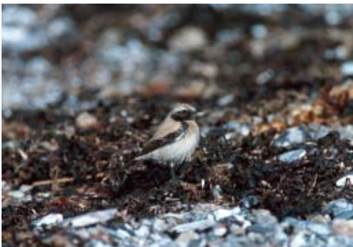
Ørkenstenpikker 2K ♂, Nordenhuse, Fyn 19. marts 1997.

Hertil kommer sager vedrørende Sølvmåge af formerne Larus argentatus cachinnans/michahellis samt Sildemåge af formen L. fuscus heuglini . Som