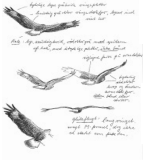
Ørnevåge, Lille Vildmose 29. juni 1997. Tegning: Jens Frimer Andersen.

1997: 29.6, Lille Vildmose (NJ), antagelig ad., *Uffe Gjøl Sørensen, *Erling Krabbe, *Jens Fri-mer Andersen.