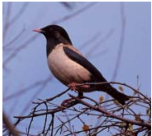
Rosenstær 2K ♂, Skagen 14/5 1999.

Tredje fund fra Blåvandshuk. Alle danske fund har været af udfarvede fugle i perioden 18/5-20/8. Hertil kommer dog en ubestemt Hætteværling/Brunhovedet Værling Emberiza melanocephala/bruniceps 8/10 1993, Blåvandshuk (RB), 1K (Rasmussen 1997). Der foreligger et enkelt fund af arten i Kategori E (20/12 1972, Birkelse ved Åbybro (NJ); Hansen et al. 1974). (Sydøsteuropa og Lilleasien; overvintrer i Pakistan og vestlige Indien)