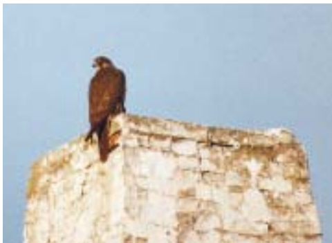
Jagtfalk 1K 19/12 1999, Hanstholm.