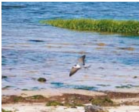
Brilleterne 28/7 1999, Langli.