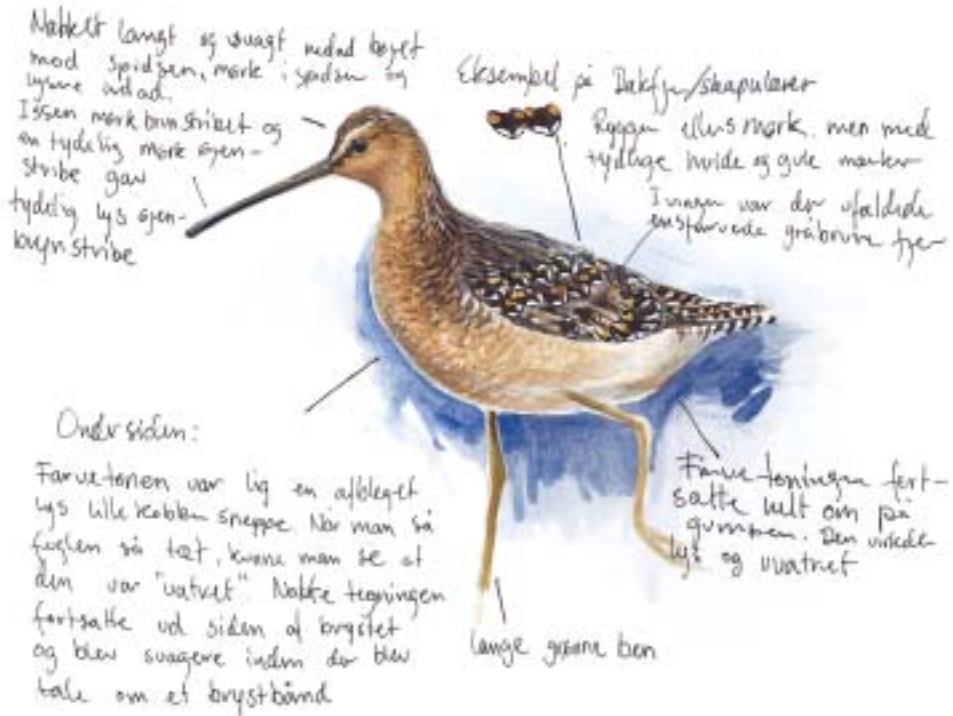
Langnæbbet Snekpeklire 25/5 1999, Vest Stadil Fjord. Akvarel af Peter H. Kristensen.