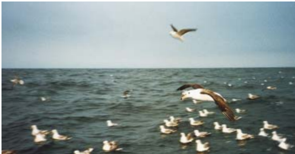
Sortbrynet Albatros 20/7 1999, nordvest for Hanstholm.