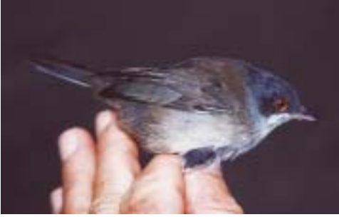
Sorthovedet Sanger ad. ♀, Møn Fyr 9/10 1998.