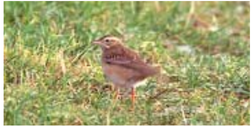
Mongolsk Piber 19/11 1999, Bygholm Vejle.

Forekomster af Spurveugle på Sjælland i forbindelse med invasionen 1999/2000 skal ikke forelægges SU, men 7 fund blev behandlet og godkendt inden denne beslutning. Der er foreløbig rapporteret 37 Spurveugler fra invasionen (Rolf Christensen i brev).