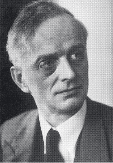
Erwin Stresemann, 1940.

og interesserede sig også for fuglenes æg og almindelige biologi. Men det var sjældent at han berørte teoretiske problemer; hans store styrke var og forblev systematikken.