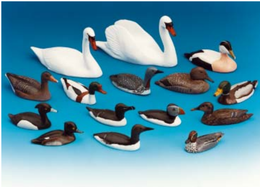
Fuglemodeller, "minibirds", med et udvalg af de skandinaviske arter.