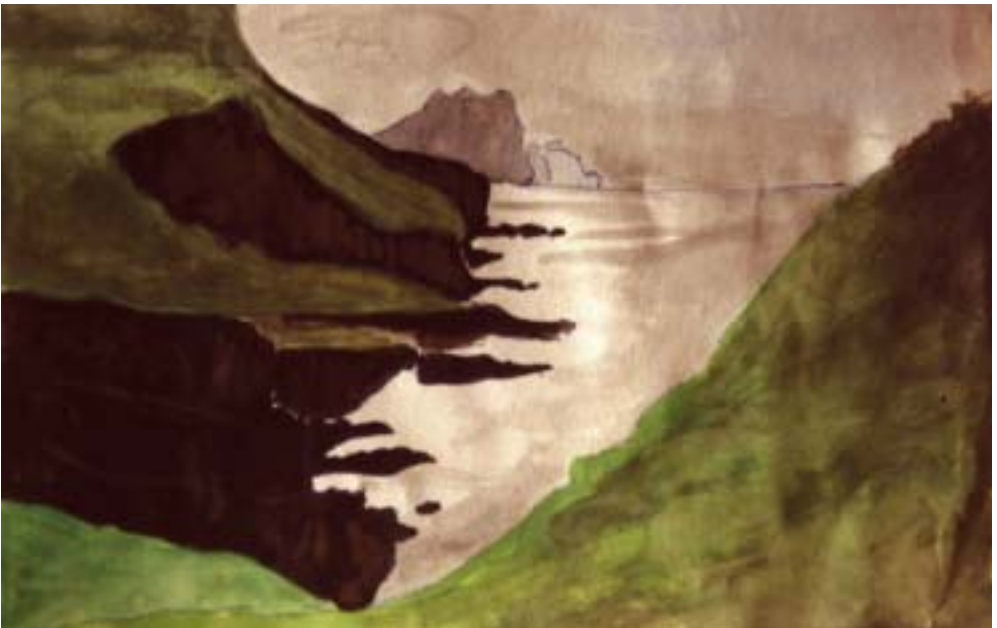
Mykines på Færøerne, malet i 1988. Sydkysten set mod øst. Lunderne yngler i grønsværen oven for de bratte klipper ned mod Atlanterhavet.