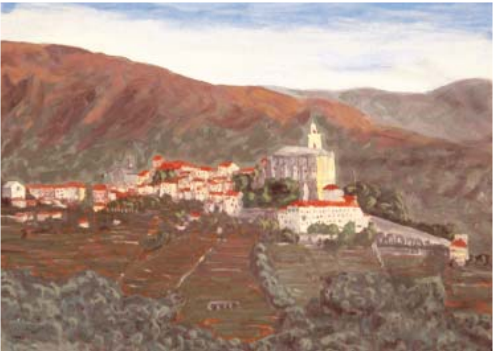
Maleri med motiv fra opholdet ved Imperia i 90'erne med bl.a. de grønne farver, som Lorenz sætter megen pris på som maler.