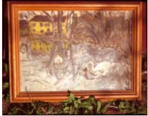
Knopsvaner ved Herlufsholm, 1934-35.

med både sin kunst og sit tiltalende, beskedne væsen en væsentlig inspiration.