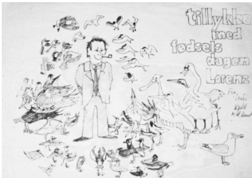
Tegning: Jens Gregersen.