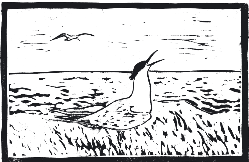
Splitterne. Linoleumstryk 1937/38.