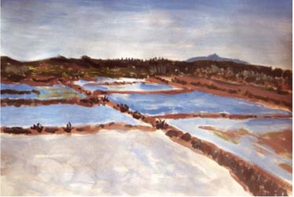
Saltsøer ved Tavira på Algarvekysten i Portugal, som nu er en vigtig fuglelokalitet. Lorenz malede billedet i 1997 under et ophold på et nonnekloster, der nu med EU-støtte er omdannet til indkvartering af naturinteresserede turister.