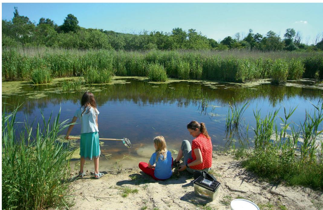
Lige fra begyndelsen var sikring af gode oplevelsesmuligheder for befolkningen en meget væsentlig målsætning for Fugleværnsfondens.

I årene 1969-1980 udgav Fugleværnsfondens årligt et magasin ved navn Fugleværn , som meget lignede vore dages Fugle og Natur . Fugleværn skulle være et kit, der bandt fondens venner sammen. Her kunne man informere om fon-