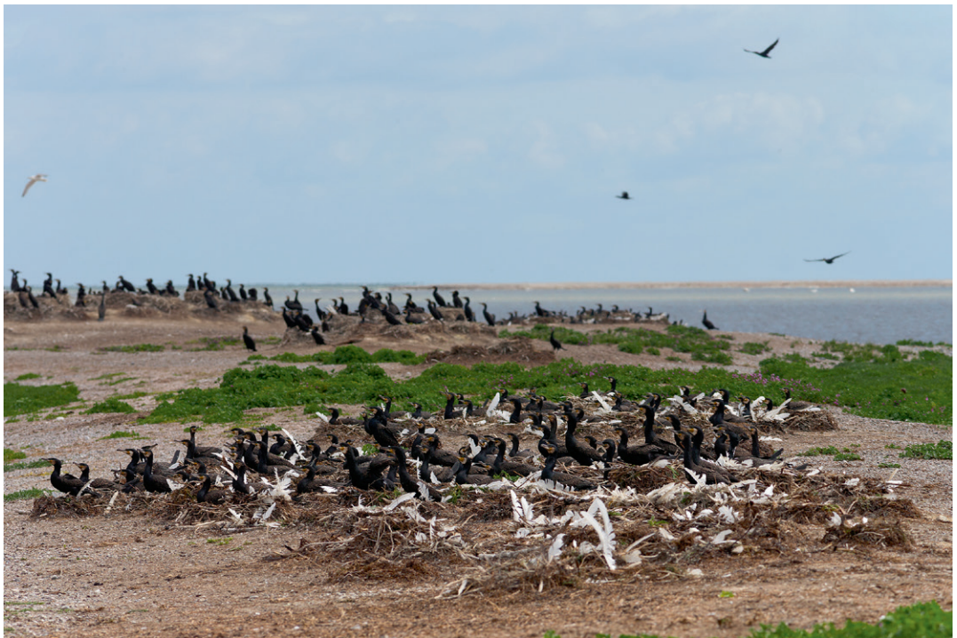
Ægholm nord for Nyord var Fugleværnsfondens første reservat og i dag yngleplads for Skarver.

I de første årtier var købet af nye fugleområder naturligt nok højt på bestyrelsens dagsorden, mens man kun gradvis blev fuldt opmærksom på, at købet af hvert nyt område medførte betydelige udgifter til administration, pleje og rekreative faciliteter. Indtægterne var godt nok