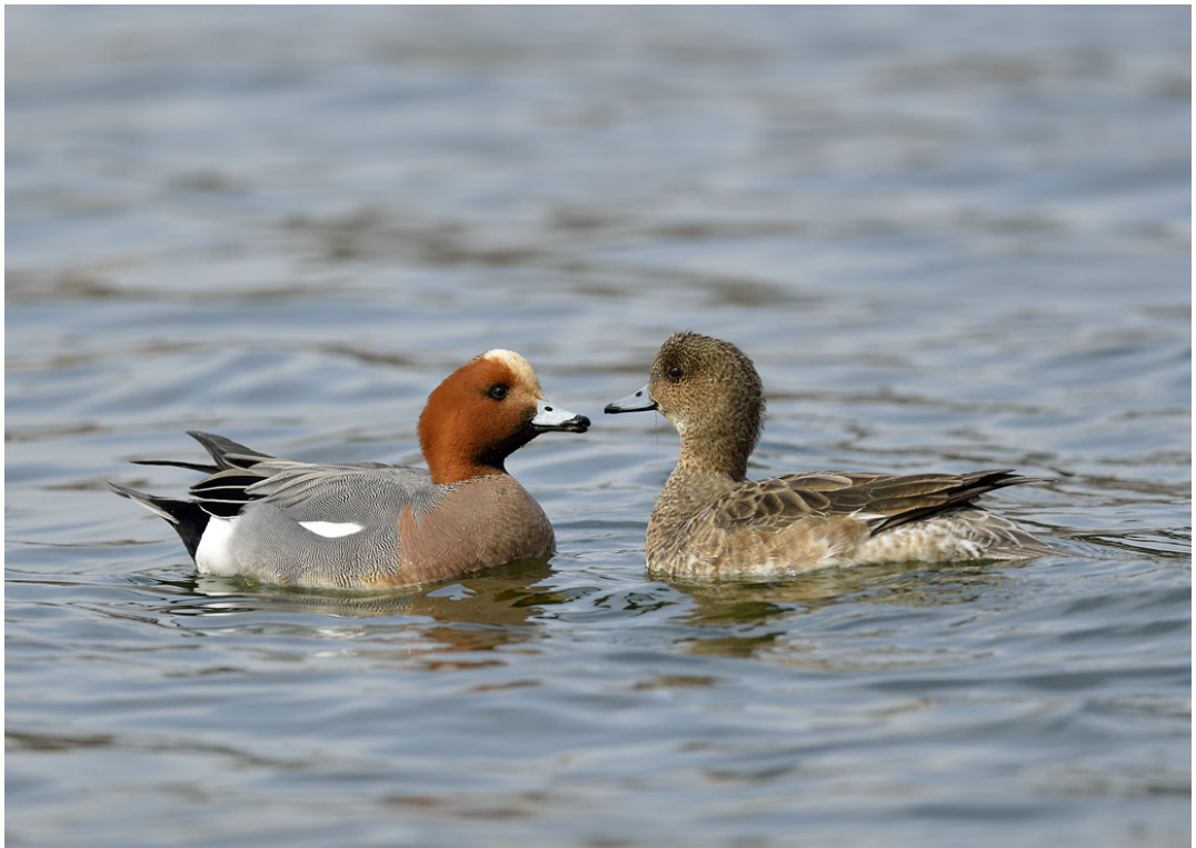
Ikke alene skulle der sikres gode yngleforhold for fuglene på reservaterne. Også trækfuglene skulle tilgodeses først og fremmest ved beskyttelse mod jagt. Foto: John Larsen, Pibeænder.

Det skal også nævnes, at Fugleværnsfonden i alle årene kun har ageret inden for landets grænser. Det internationale perspektiv – fugle kender ingen grænser – har været overladt til andre. Fondens har derfor i en årrække blot ydet økonomiske støtte til DOFs internationale arbejde med at beskytte vore trækfugle, når de ikke 'var hjemme'.