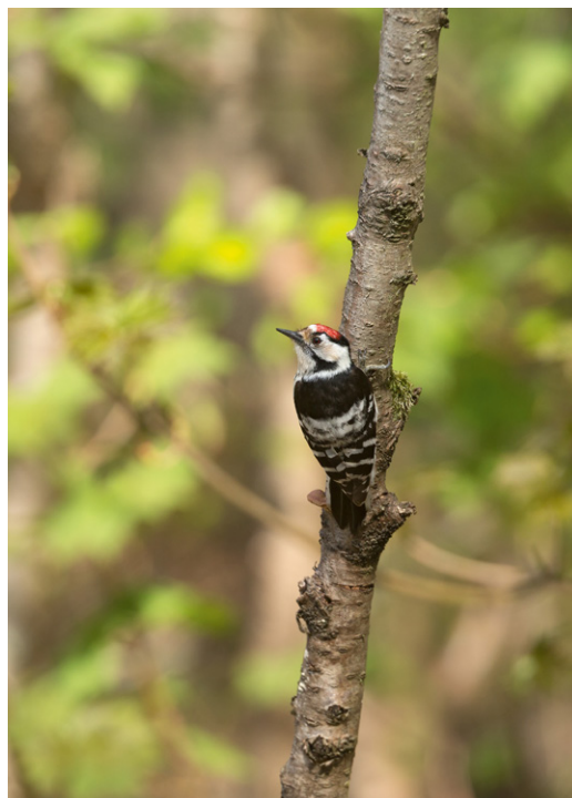
Hvor kyst- og andre vådområder stod højt på Fugleværnsfondens ønskeseddel de første mange år, er skovområder i stigende grad kommet på dagsordenen. Foto: Allan Gudio Nielsen, Lille Flagspætte i reservatet i Vaserne ved Furesøen.

Alligevel har Fugleværnsfonden fortsat stor betydning. Den giver mange mennesker, herunder skolebørn, mulighed for at opleve fugleliv på nært hold, og Fugleværnsfonden er garant for en fortsat sikring og pleje af fugleområderne. Fugleværnsfonden repræsenterer i øvrigt en kontinuitet, der fx viser sig ved, at fonden har stået for fortsatte tilkøb til flere fuglereservater gennem 20, 30 eller 40 år.