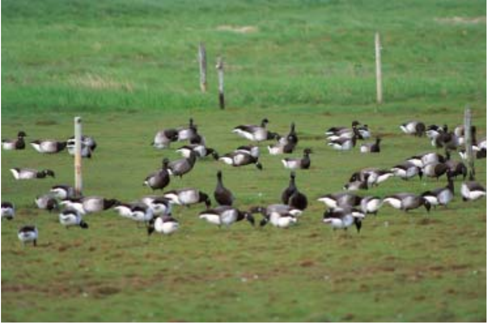
Sortbuget Knortegås ad., Agerø 16/5 2001 (fuglen i midten) i flok med Lysbugede og Mørkbugede Knortegæs.

Black Brant (center) with Dark-bellied and Light-bellied Brent Geese.