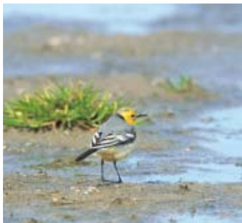
Citronvipstjert 2K ♂, Værnengene 1/5 2001. Citrine Wagtail.

Landets andet fund af Gråsejler og den første fugl observeret og bestemt i felten. Arten var hidtil blot repræsenteret med en dødfunden fugl 11/3 1993 Kirke Helsing (S) (Nielsen & Thorup 2001, Thorup 2001). Den aktuelle fugl dukkede op i forbindelse med en relativ varm luftstrøm fra det sydvestlige Middelhav og udgør det nordligste fund under en invasion til Nordvesteuropa i oktober 2001. Således havde Storbritannien 9 fund 2-31/10 (Colin Bradshaw i brev) og Nordfrankrig 1 eks. 20/10 og 24/10 (Phillippe J. Dubois i brev).