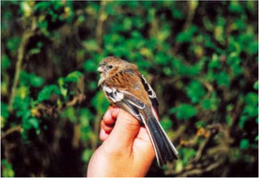
Langhalet Karmindompap 2K+ ♀, Blåvand 11/5 2001. Long-tailed Rosefinch.

Krumnæbbet Ryle Calidris ferruginea 2001: 6.12, Vester Vedsted Sluse (RB), *Michael Schwalbe.