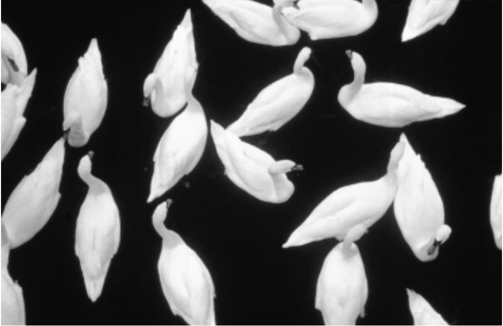
I gennemsnit vil én ud af disse 20 Knopsvaner have hagl siddende i kroppen efter at være blevet ulovligt beskudt et sted i Danmark.

Undersøgelsen blev udført, mens PAH og BC arbejdede for Danmarks Miljøundersøgelser. Forfatterne vil gerne takke personalet i Falck for velvillig indsamling og mærkning af fuglene, og en særlig tak rettes til personalet på Falck Miljø i Farum for den store hjælp med organiseringen af indsamlingen.