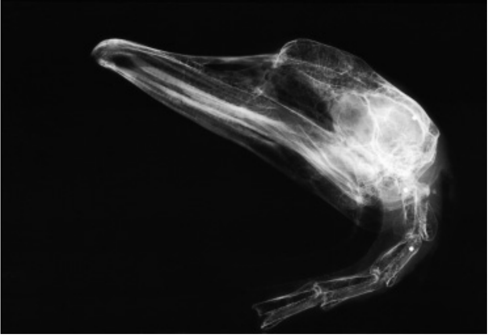
Fig. 1. Røntgenfoto af hovedet af en Knopsvane med 3 indskudte hagl. Fuglen er ikke død af haglene, men formentlig af sult. Marts 1996.

X-ray picture of the head of a Mute Swan with three gun-shot pellets. The bird did not die from being shot but probably from starvation. March 1996.