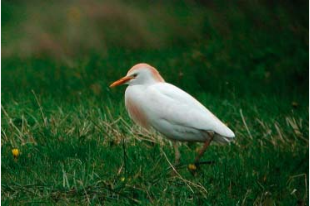
Adult Kohejre, Haurvig, Hvide Sande 25/4 2002. Cattle Egret.