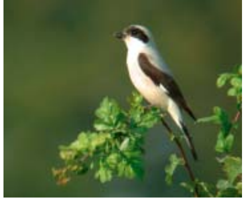
Rosenbrystet Tornskade, Porsemosen, Ballerup 31/7 2002. Lesser Grey Shrike.