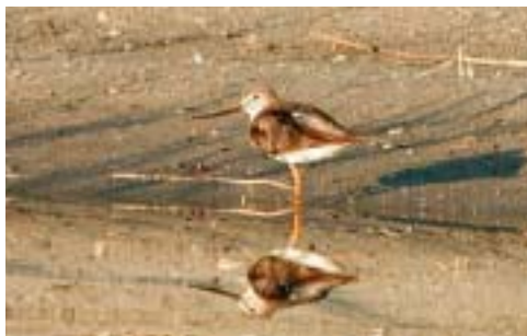
Terekklire, Rærup, Vodskov 8/6 2002. Terek Sandpiper.

Ny art for landet. Der var tale om den samme fugl begge steder. Fundet er nærmere behandlet af P.H. Kristensen (2002). Det danske SU følger AERC TACs (Taxonomi Advisory Committee of the Association of European Rarities Committees) taxonomiske anbefalinger, men TAC har endnu ikke behandlet en eventuel opsplitning af Hvidvinget Måge Larus glaucooides . Ved amerikanske arter, som TAC ikke har behandlet, følges i stedet American Ornithologists' Union's officielle amerikanske liste ( www.aou.org/aou/birdlist.html ), og her er Thayers Måge opført som en selvstændig art. (Nordvestlige Canada)