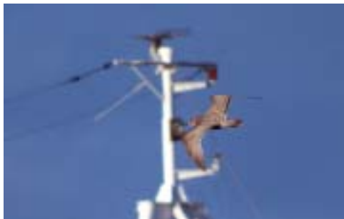
Thayers Måge (2K), Hanstholm Havn 19/2 2002. Thayer's Gull.