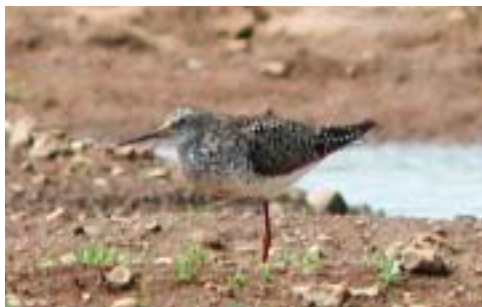
Lille Gulbenet Klire, Skjern Enge 3/6 2002. Lesser Yellowlegs.

2002: 8-9.6, Rærup, Vodskov (NJ), *Anton Thøger Larsen m.fl. (Foto). – 26-27.7, Måde Enge, Esbjerg (RB), *Jens Thalund, Per Poulsen m.fl. via Ole Amstrup (Foto).