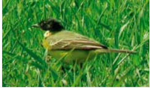
Sorthovedet Gul Vipstjert, 2K ♂, Skagen 19/5 2002.

2001: 16.10, Tipperne (RK), 1K, *Ole Amstrup. Landets tredje fund på fire år. Som det var tilfældet med landets to første fund, blev også denne fugl opdaget fra en kørende bil! (Mongoliet; overvintrer i Indien og Sri Lanka)