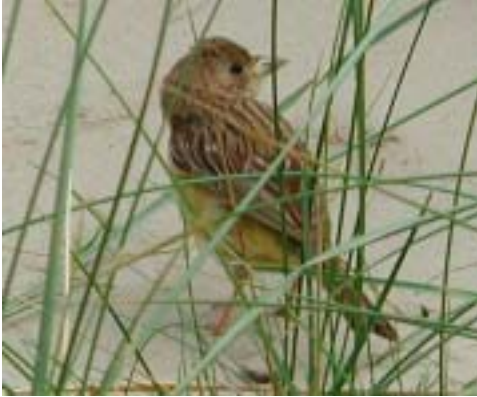
Brunhovedet Værbling/Hætteværbling, 1K+ ♀, Hønen, Fanø 7/9 2002. Red-headed or Black-headed Bunting.