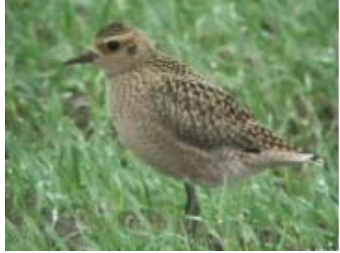
Sibirisk Tundrahjelle 1K, Raghhammer Odde, Bornholm 14/10 2002. Pacific Golden Plover

Fuglen rastede i længere tid på den tyske side af grænsen i Rickelsbüller Koog. Ved en enkelt lejlighed sås den flyve over grænsen til Margrethekog, hvorfor den