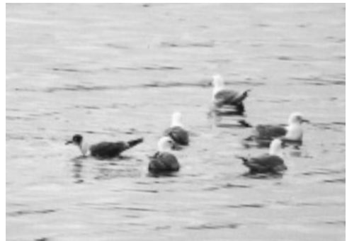
Præriemåge (2K), Nólsoy 20/6 2002. Franklin's Gull .

2002: 12.10, Grøv ved Klaksvík, Borðoy, *SiO. Det nærmeste yngleområde er på Ydre Hebrider. De i alt 8 fund (de fleste omkring 100 år gamle) er gjort om foråret eller sent på efteråret, og passer med strejf/træk fra denne bestand. Til sammenligning er alle (!) 19 fund på Island (til og med 2000) fra foråret (Kolbeinsson et al., Birding Iceland's hjemmeside).