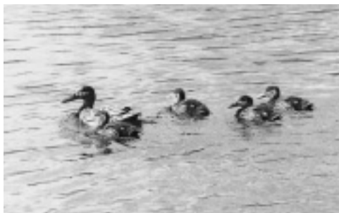
Skeand, Sandsvatn 2/8 2002. Shoveler .

Med fire fund er 2002 det hidtil bedste år. Samtidig må det konstateres, at fuglen ved Morskranes er væk efter