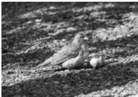
Karmindompap, Kunoy 26/5 2002. Rosefinch .

2002: 14-25.3, Argir, Streymoy, 2 ♀♀, *HES (foto).