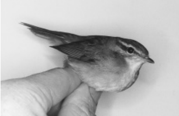
Schwarz Løvsanger, Nólsoy 18/10 2001. Radde's Warbler.