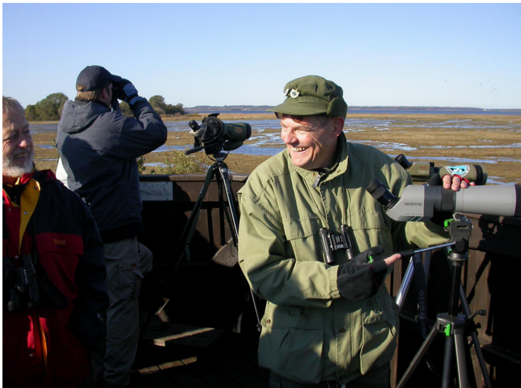
Igennem sin 50-årige eksistens har Fugleværnsfonden ændret fokus fra at være næsten alene om at forsøge at redde så mange fine fuglelokaliteter som muligt ved opkøb til i højere grad at etablere righoldige 'udstillingsvinduer' for fugle- og naturbeskyttelsen. Foto: Allan Gudio Nielsen, fugletårnet på Nyord Enge.