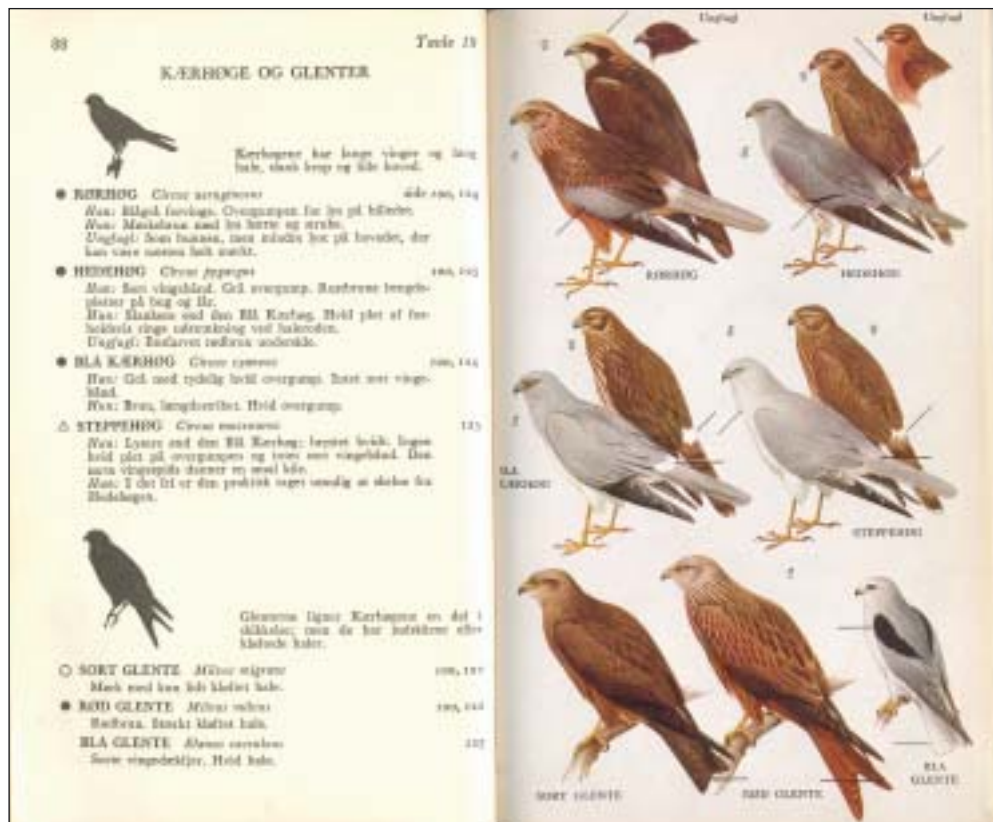
Fig. 2. A field guide to the birds of Britain and Europe (R.T. Peterson m.fl.) fra 1954 udkom i dansk oversættelse som Europas Fugle i 1960 og var en milepæl hvad bestemmelsehåndbøger angår. Med de særdeles gode farvetavler med små stregmarkeringer af artens karakteristiske kendetegn var den nærmest en revolution.

bog, der sætter nye standarder for det at bestemme fugle under fremmede himmelstrøg."