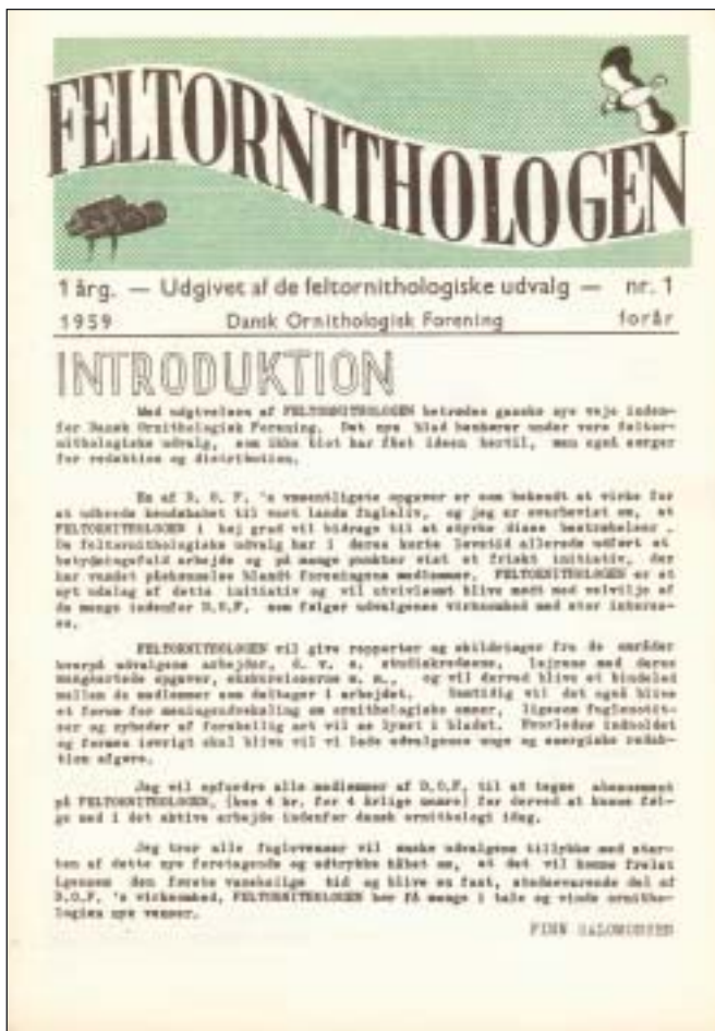
Fig. 3. Feltornithologens debut i 1959. Et årsabonnement kostede 4 kr.