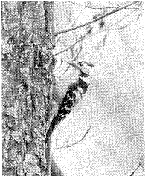
Lille Flagspætte.