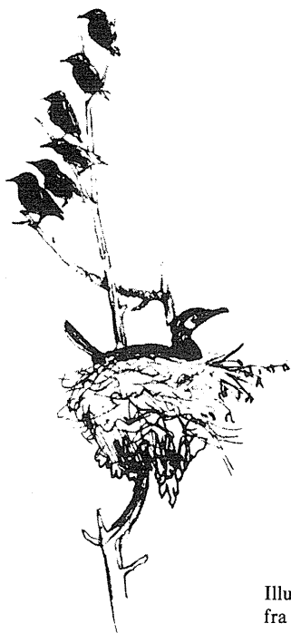
Illustration fra bogen

jagtmodstander. Han er snarere indigneret over jægerens vanemæssige holdning til vildtet som noget, der kun er til for at høstes, samt hans tit kortsynede mangel på forståelse for de dybere årsager til vildtets livsbetingelser.