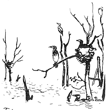
Tofte sø 19/7 82 Illustration fra bogen