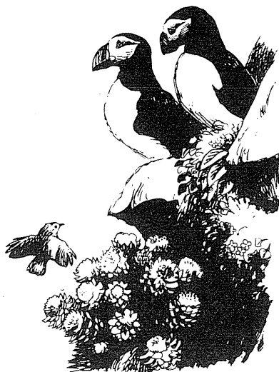
Illustration fra bogen

Artens evne til spredning og tilpasning har i Europa resulteret i adskillige isolerede bestande, bl.a. på de atlantiske øgrupper. Forfatteren beskriver