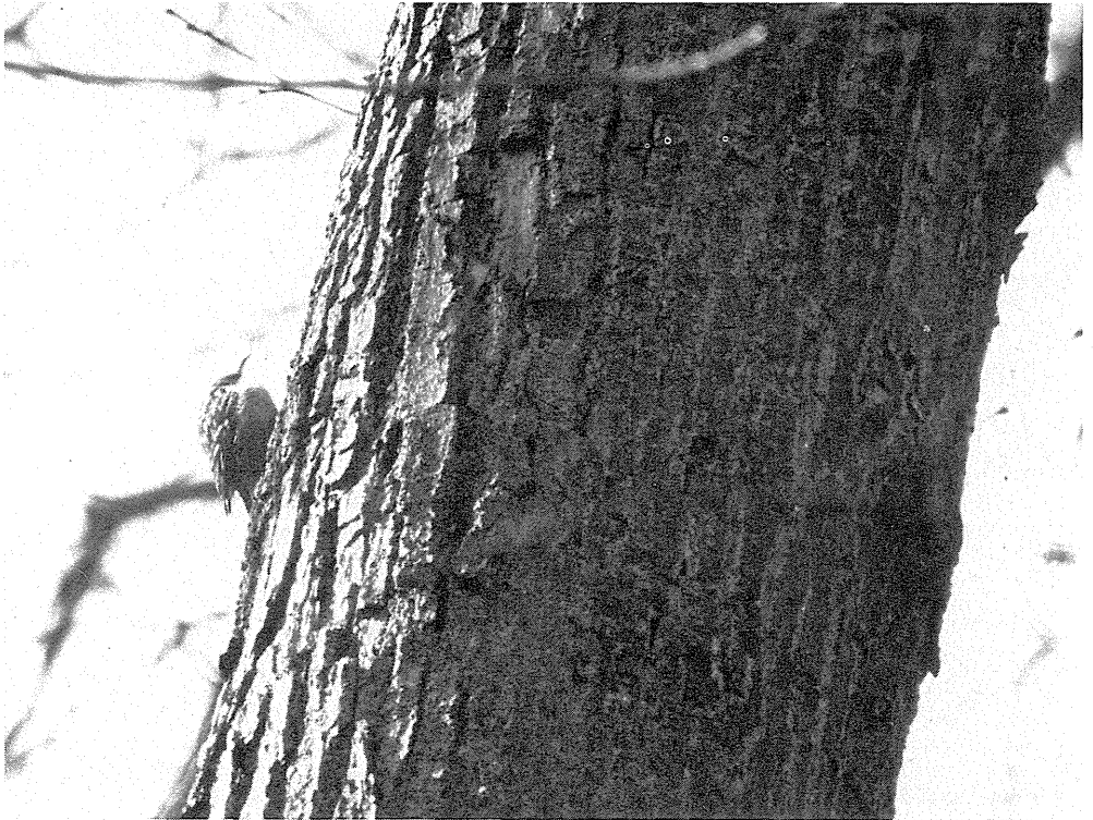
Korttået Træløber, Vallø.

Det første fund fra Falster er et individ fanget i Gedser 7. oktober 1972 (Bent Bøggild Pedersen in litt.). Fra Lolland og Falster foreligger der derudover kun oplysninger fra en intensiv eftersøgning i marts 1983. Flere egnede herregårdslokaliteter blev besøgt, og Korttået Træløber blev registreret på fire: Pederstrup (Reventlowsparken) på Midtjylland (en syngende han og to kaldende individer), Holcksmind Skov ved Rodsnæs, Nordjylland (en syngende han, der strejfedede omkring i skoven), Svingelen, bypark i Naskov (ét par), og Corselitze på Østfalster (en syngende han). På 16 andre lokaliteter blev der kun fundet Almindelig Træløber.