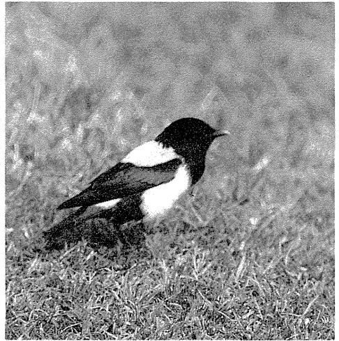
Rosenstær. Mykines, 2. juni 1985.

Dette er 5.-7. fund af underarten fra kontinentet og det britiske hovedland. 4. fund (1979) var også en han i marts. Underarten optræder antageligt årligt, men er overset p.g.a. bestemmelsesproblemet.