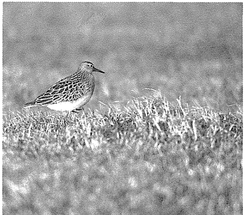
Stribet Ryle. Akraberg, 23. oktober 1987.

Dette er de første kendte Lomvier fra Færøerne, der har vist karakterer svarende til den lysere gråsorte underart U.a.albionis . Denne findes sydligst i udbredelsesområdet og går i SV-Skotland gradvist over i U.a.aalge , som også udgør den færøske ynglebestand. Fra ringmærkningen kendes der foreløbig 48