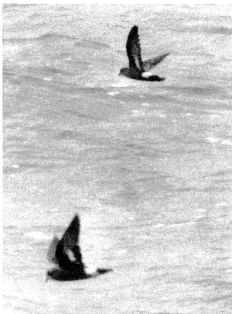
Det hvide felt på undervingen af Lille Stormsvale er et af de bedste feltkendetegn.

De gængse kendetegn – såsom kløftet hale, mørk streg gennem overgump og lysegråt bånd på øvre vingedækkfjer – kan kun bruges på ret kort af-