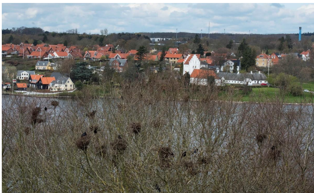
Det typiske billede af en svendborgensisk rågekoloni, her på Tåsingesiden af Svendborg Sund og med Skt. Jørgens Kirke.

Det ses på kortet med den gamle kommunegrænse, at der er en tendens til, at kolonierne anlægges kystnært, så der i kommunens nordlige del overhovedet ikke ses Rågekolonier. Det er svært at give en forklaring, så meget desto underligere, da Midtfyn med Ringe udgør et andet tyngdepunkt for Rågens udbredelse på Fyn. Vigtigt er det øjensynligt, at der skal være fri indflyvning til trækronen, hvor reden er anlagt, derfor ses de større kolonier som regel, hvor terrænet er skrånende og giver en større kronekuppel.