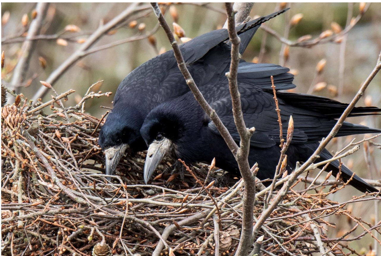
De opmærksomme forældrefugle følger med i afkommets tilstand. Er der ikke helt menneskeligt?

Generelt bryder jeg mig ikke om, at fugle efterstræbes i deres yngletid. Det sker da også på grund af et smuthul, som gør, at visse arter kan reguleres, selvom de ikke har en jagttid. For Rågen gælder undtagelsen, at de kan skydes af lodsejeren efter en skriftlig tilladelse fra staten. Denne kan dog uddelegeres, i Svendborg altså til Jægerråd Svendborg. Reguleringen begrundes med, at fuglene gør skade enten på afgrøder eller på menneskers sundhed ved at de larmer for meget. Tidligere havde kommunen også tilladelse til at bekæmpe voksne fugle. Mine optællinger giver ikke belæg for at intensivere "reguleringen" i ynglekolonierne, og generelt er min holdning den, at man kun bør regulere, såfremt der er klager.