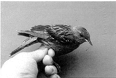
Alpejernspurv, Christiansø, 21. juni 1990.

Efter den overraskende iagttagelse fra Skagen 8.5 1988 (Olsen 1989) skulle landet altså igen gæstes af denne art.