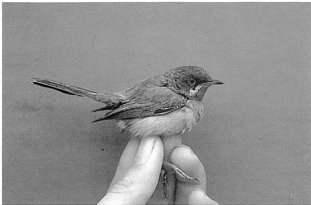
Hvidskægget Sanger han, Christiansø, 13. maj 1990. Subalpine Warbler.