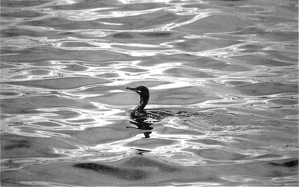
Topskarv, Vidåen, 20. januar 1990. Bemærk spinkelt næb, slank hals og lille hoved med stejlere pande end Storskarv.