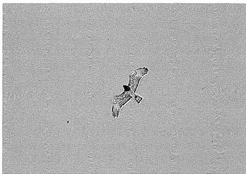
Slangørn, Skagen, 1. maj 1990. Short-toed Eagle.

Fundet bliver således landets første, da det andet er fra 23.6 1930, Hanstholm (Dybbro 1978). De nærmeste yngleområder findes i steppezonen nord for det Kaspiske Hav. Det er iøvrigt en art, man må kunne forvente herhjemme i en nærmere fremtid, trods at den er på den sovjetiske "Røde Liste" over truede arter (Marchant et al. 1986). Arten sås første gang i Sverige i 1989 med 3 eks. (Elmberg 1990), og på de Britiske Øer har der været 33 fund til og med 1990 (Rogers et al. 1991).