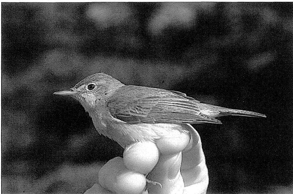
Spottesanger, Blåvand, 1. juni 1990. Bemærk i forhold til Gulbug en kortere vinge og intet tydeligt vingepanel.