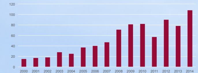
Kilde: Truede og sjældne ynglefugle i Danmark 1998-2012, DOFT 108: 1, 2014 og Fokuseret Fugleforvaltning