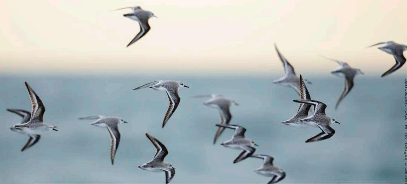
Sandløber.