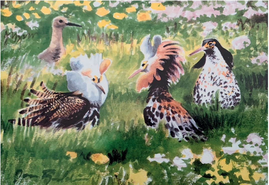
Jons talent spænder fra det stramme til det mere spontane som her Brushaner på danseplads i Polen i 1992. Fra bogen Portrait of a Living Marsh , Inmerc 1993.

Dengang i Silkeborg – da den store fugleudstilling blev forberedt, var der nogle sammenkomster, som antog festlige dimensioner. Blandt andet blev der arrangeret en sejltur med Hjejlen ude på Silkeborgsøerne. Her bril-