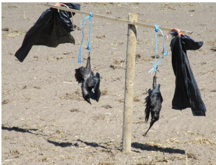
Døde Råger brugt som skræmmefugle på Sydlangeland ved majsmark.

Mine Rågeoptællinger hvert forår i næsten 20 år har givet mig mange gode oplevelser. Her har jeg til Rågens lydtapet fået set de første engkabbelejer blomstre, hørt den første Gransanger, mødt den første citronsommerfugl og fulgt bøgens udspring. Her følges naturens dagbog gennem en måneds tid og Rågerne udgør en uundværlig lydkulisser. Foråret er over os og det er det mest livsbekræftende budskab i tilværelsen for en naturglad fynbo -midt i en biodiversitetskrise.