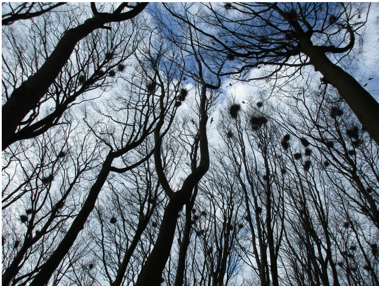
Et kig op i Rågekolonien kort tid efter tællingssæsonen er gået i gang. Uoverskueligt? Det er et spørgsmål om øvelse. Rågekoloni i bøgetræer den 2. april, før skoven springer ud.

Normalt starter jeg ud med Rågetællingerne i slutningen af marts, da er Rågerne aktive og fremfor alt, træerne har endnu ikke fået blade. I år begyndte jeg den 25. marts, mens sidste koloni blev besøgt den 28. april, der kan altså let gå en månedstid med det, for ofte må en koloni besøges et par gange for at få vished for, at der ikke er liv.