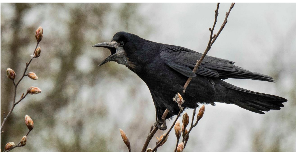
Rågen råber sit navn ud. Det giver den problemer.