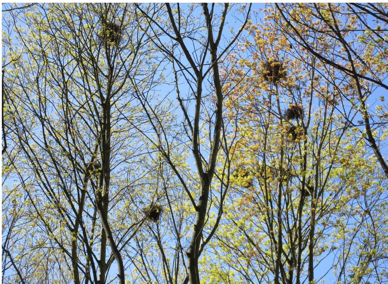
En smuk forårsdag i kolonien ved Thurøs boldbaner. Træerne er ahorn i udspring. 28. april 2022.