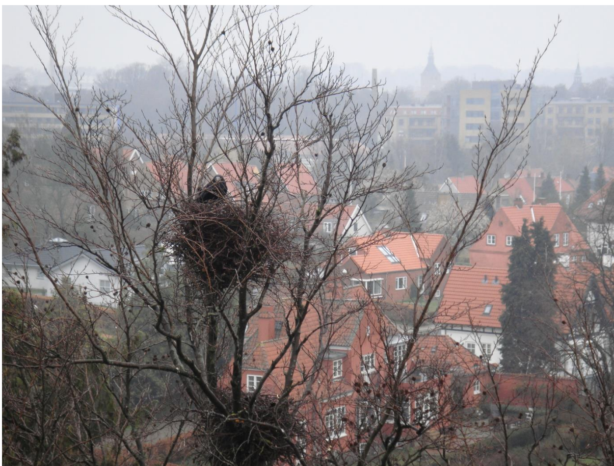
Rågen er Svendborgs signaturfugl.

Mine optællinger fra Svendborg giver ikke belæg for at intensivere "reguleringen" i ynglekolonierne i Svendborg, og generelt er min holdning den, at man ikke automatisk skal rykke ud, men kun såfremt der er klager.