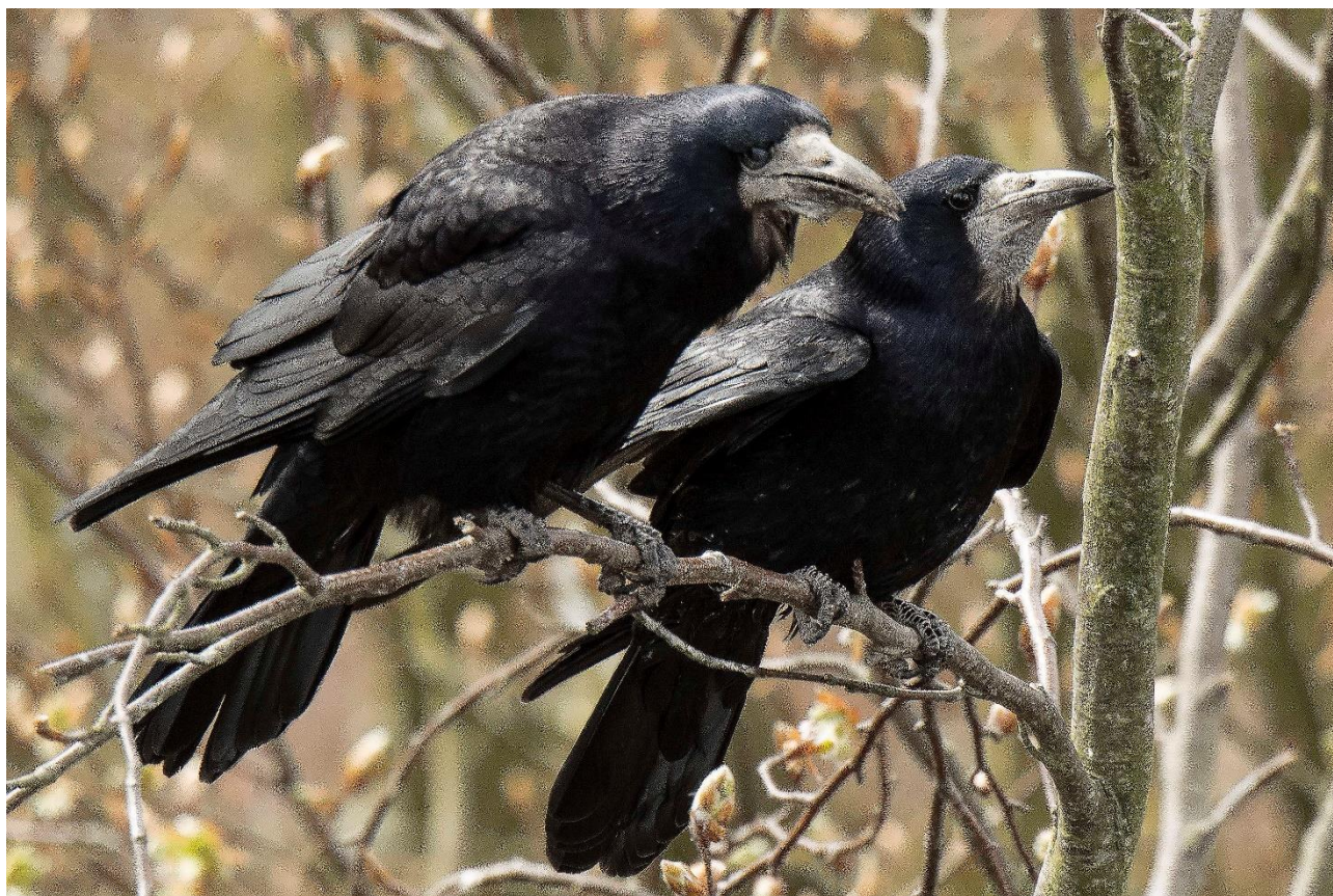
Rågepar fra kolonien i Braten Skov, her kan fuglenes privatliv studeres fra Svendborgsundbroen.

Det er altså en tidsserie på næsten 20 år, der nu er tilvejebragt. Og det kan siges, at bestanden ikke er eksploderet. De 1179 par i 2004 er blevet til 1165 her i 2021.