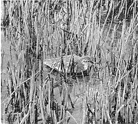
Unge af Rødben.

Hvad ellers Vaderne angaar, skal jeg fatte mig i Korthed, da jeg mener, at Terner og Maager i denne Sammenhæng frembyder mere Interesse, saa jeg vil hellere beskæftige mig lidt nærmere med dem.