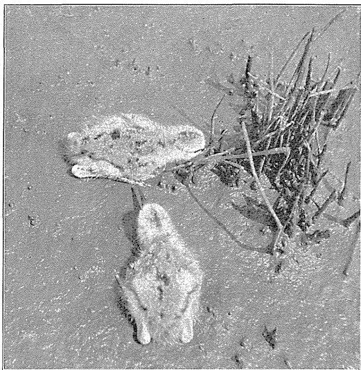
Dununger af Klyde.