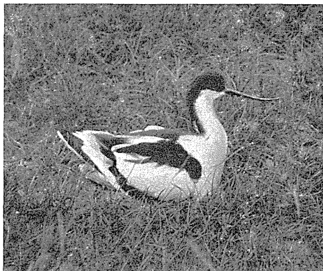
Rugende Klyde.

Dette Tegn var jo i og for sig ikke lysteligt, og tristere bliver det, om vi vil betragte Bestanden som Helhed, thi da var der en mægtig Tilbagegang at spore. Det er naturligvis uhyre vanskeligt blot at skulle angive nogenlunde Antallet af Par, naar de ynglede saa spredt, men jeg er vist paa den rigtige Side, naar jeg regner dem til c. 150—200 Par gamle Fugle i 1912. Se, det er jo en sørgelig Tilbagegang, og at det ikke har været noget tilfældigt det Aar, fremgaar af Brev til mig fra Opsynsmanden H. Jepsen, der, i Paranthese bemærket, er en virkelig dygtig Kender af Fuglene derovre og nærer en varm Interesse for dem;