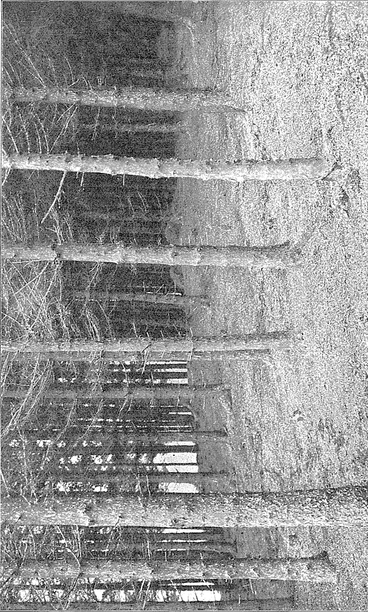
Jordbunden i Kvæernes Nattekarter, næsten hvid af deres Eiskremelter.