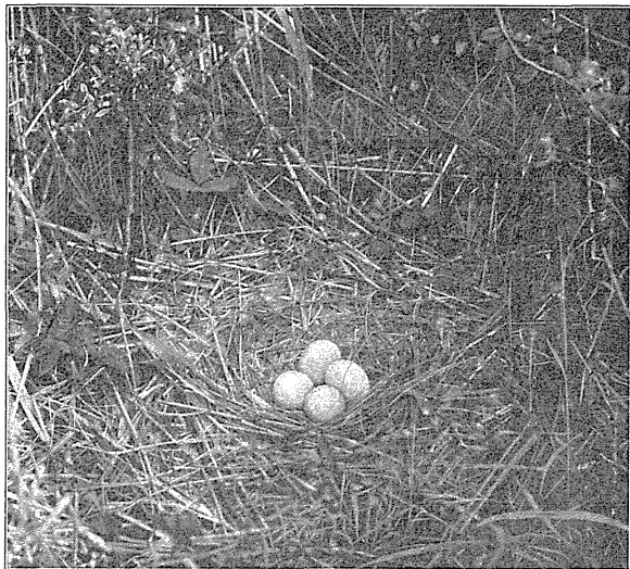
Rede af Graa Kørhøg.

Ringduen ( Columba palumbus ) var at træffe i alle Smaaskove