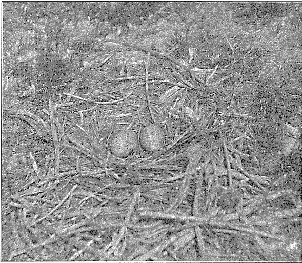
Rede med Æg af Havmaage.

Ællinger, jeg saa saaledes 8 Ederfugle gaa i Vandkanten udfor Halen med tilsammen 3 Ællinger; om det var Resterne af en større Yngel, som den vaade Sommer havde formindsket, eller den graa Havmaage, af hvilken nogle opholdt sig i umiddelbar Nærhed af Flokken, havde fourageret for stærkt iblandt dem, eller det muligvis kun var de første af Aarets Unger, der var naaet Havet, skal jeg lade staa hen. Af Gravanden saas enkelte