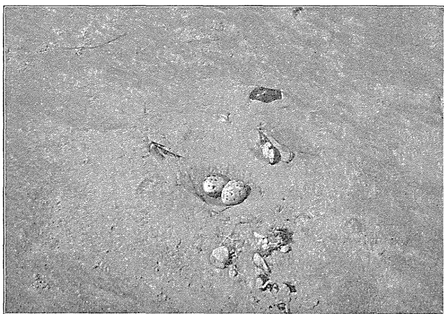
Æg af Dvergterne.

hyppig i Egnen, hvor de mange Tjørnehegn særlig omkring Gredstedbro byder den udmærkede Betingelser; den ses daglig paa Telefontraadene og skræpper, naar man nærmer sig Reden; men efter at Ungerne er ude, saa er de alle væk, og der maa dog paa det Tidspunkt være tre Gange saa mange at kigge efter som under Yngletiden. Gøgen, der er meget mere faatallig, ser man dog tit, selv efter at den er holdt op at gale, enkeltvis