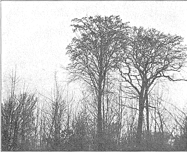
Stæreflokke i Bøge.