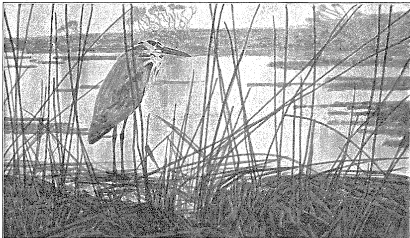
Hejre ved Fjorden.

Det er efterhaanden blevet mange Ture af lignende Art, jeg har udført i Aarenes Løb, og dog er Aftenerne ved Fjorden ikke mindre tiltalende. Man kan anbringe sig i Strandkanten skjult af Tang og iagttage de trækkende Fugle, naar man ser i den