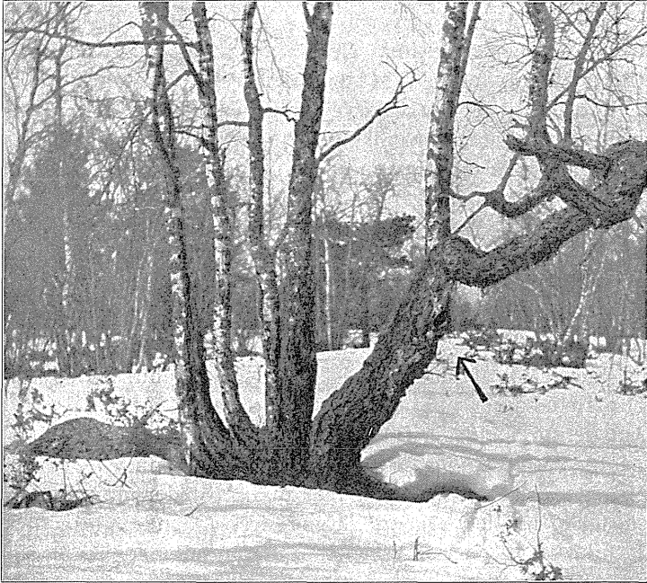
Fig. 2. Hvinanderede i hul Birk (Pilen peger mod Redehullet). Haukipudas Satakari 1910.

Saa er der tilbage Hvinanden, der synes endnu mere knyttet til hule Træer, end i hvert Tilfælde den store Skallesluger; den har aabenbart søgt at undgaa sin truede Tilværelse ved at