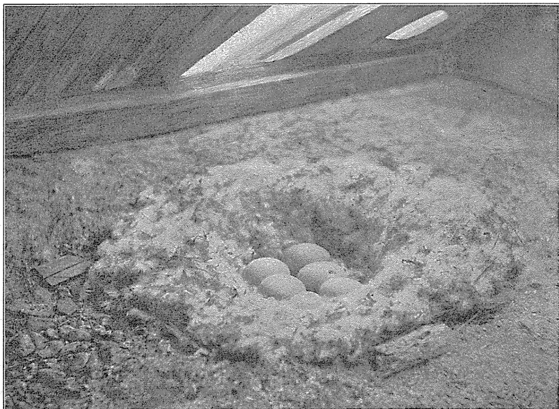
Fig. 1. Rede af Stor Skallesluger paa Loftet i en Fiskerhytte. Ji, Selkäletto 12—6—08.

Fig. 1 viser en Skalleslugerrede paa Loftet af en Fiskerhytte paa det lille, øde Selkäletto-Skær i Ii (Jjo), nogle Mil Nord for Uleåborg. En af Tagspaanerne var borte, og denne Aabning benyttede Fuglen til at komme ind og ud af. Foruden oven-