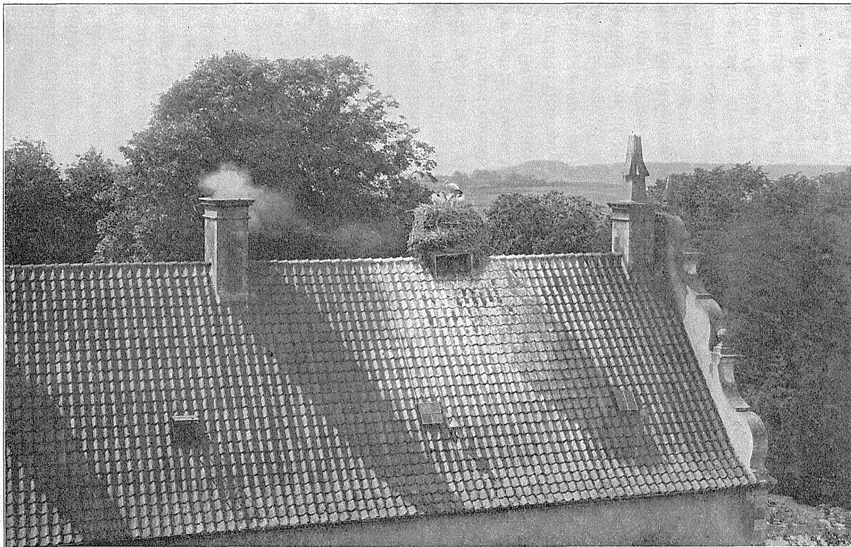
Storkereden før 1915. Skorstenen med Røghætten er Redens oprindelige Plads.