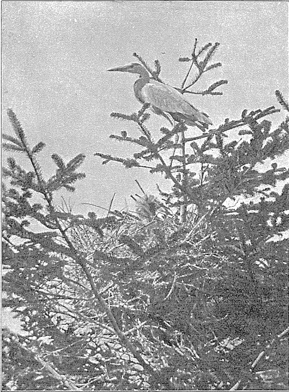
Hejre ved Reden, Store Lyngby Skov, 5. Maj 1912. H. Weis fot.

om dem; ja, hvis man lagde sin Haand paa dem, kunde man knap mærke, at de rørte sig, selv om Rederne oppe i Topgrenene svajede i Vinden. Turde man overhovedet krybe op ad saadan en tynd Gren? Og var man endelig kommet op under Reden,