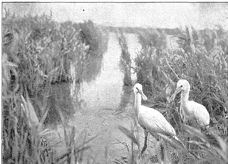
To omtrent fire Uger gamle Unger af Skejere, Platalea leucorodia . Fot. af A. Heilmann den 17. Juli 1928.