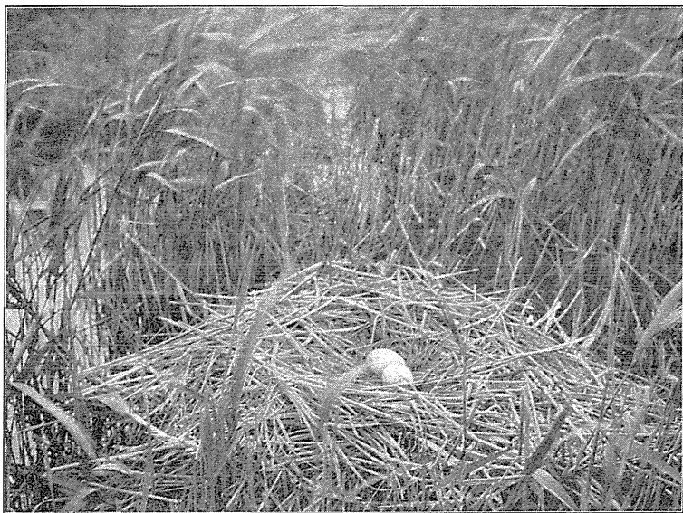
Den største Rede af Skejere, Platalea leucorodia . Fot. af A. Heilmann den 10. Juli 1928.