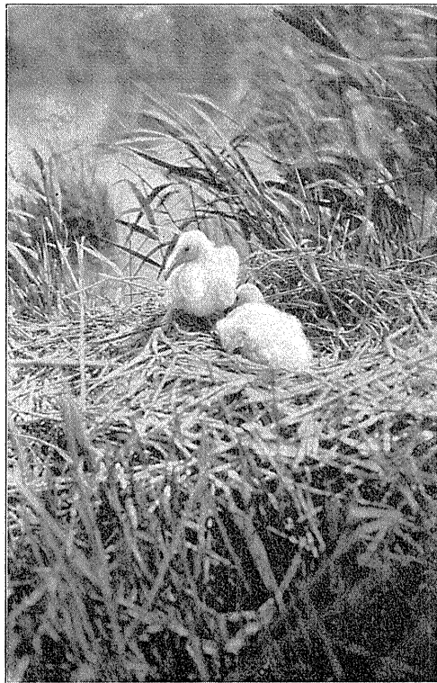
Unger af Skehejre, Platalea leucorodia , omtrent 1 Uge gamle. den 1. Juli 1928.