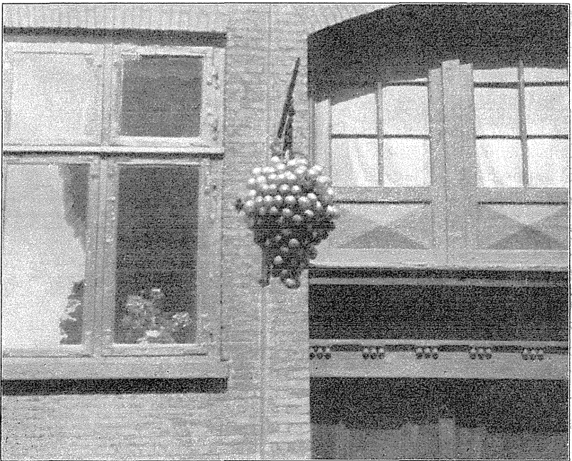
Redested for Svenske, Chloris chloris .