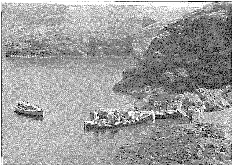
FOL: B LÖPPENTHIN

Næste Morgen, Lørdag 7. Juli skulde en lang Række Turistbiler starte fra Pladsen foran University Museum i Oxford. Om langtfra alle, saa deltog dog Størsteparten af Kongresdeltagere i denne Ekskursion, som skulde gaa til Pembrokeshire i Wales; det egentlige Maal var 3 Smaaøer med de nordisk klingende Navne: Skokholm, Skomer og Grassholm. — Bortset fra Opholdene for Lunch og Té samt et Par tilfældige Smaapauser sad man i Turistbilerne hele den udslagne Dag. Kl. godt 19 naaede man endelig Badestedet Tenby, hvor man blev indkvarteret paa forskellige Hoteller. Om Aftenen spredtes Ornitholo-