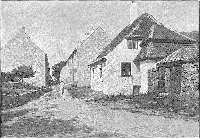
A. KJØLLER fot.

korps i København, hvor han tjente sig op til Sergent. Hans Forhold i denne Militærtjeneste kan vel næppe have været helt eksemplariske, da Faderen i 1744 fik Kongens Tilladelse til at oversende ham til Arrest og Arbejde paa Fæstningen Christiansø mod, at Faderen selv afholdt hans Underhold. Det med Arresten skal maaske ikke tages alt for bogstaveligt; det drejede sig vel nærmest om en Slags Forvisning, men hermed