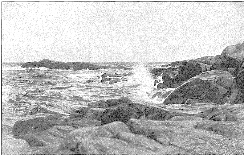
Kystparti fra Christiansø.