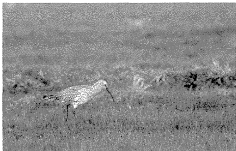
Tyndnæbbet Spove.