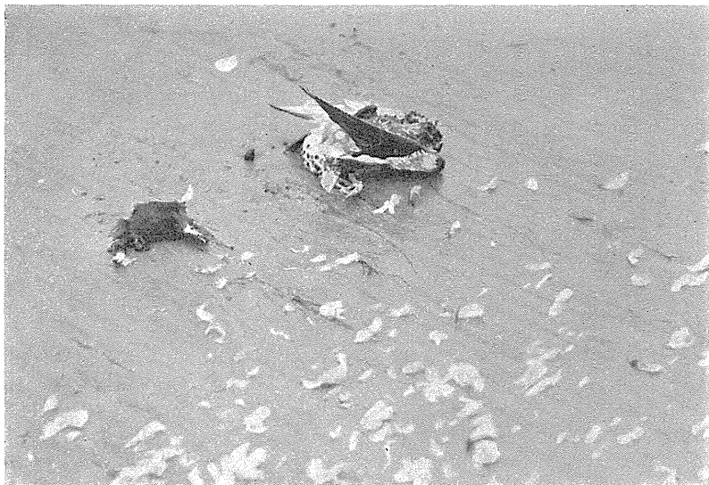
Vandrefalkens Bytte: En Pipeand. Brystet er revet op, og det afrevne Hoved ses til venstre. Jordsands Flak, 4. Okt. 1931.

maaske for at hjælpe dem med Byttets Sønderdeling. Ved 17 Tiden fløj ♂ forbi med vistnok en Allike i Klørne. ♀ fløj da straks ned fra sin Vagtpost og bagefter ham, men havde intet Bytte med, da hun atter viste sig. Jeg blev ikke klar over, om ♀ selv fangede sit Bytte eller modtog det af ♂, paa samme Maade som hos f. Eks. Kærhøgene. ♂ kom dog aldrig i Redens Nærhed, saa jeg anser det for sandsynligt, at kun