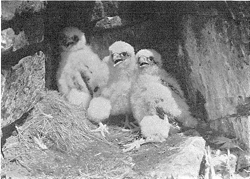
Et Kuld Vandrefalkeunger, ca. 20 Dage gamle. Bornholm, 9. Juni 1937.

falke eller ej. Af almindelig Nysgerrighed var jeg klatret ned til Klippernes Rand fra Stien, som næsten følger alle Øens Klippekyster. Pludselig kredsede en Vandrefalk omkring mig (3. Juni Kl. ca. 17). Dens hæse, stærke Skrig fortalte indtrængende om Yngel ikke langt borte. Jeg fulgte Klippekannten en Times Tid, men Kysten var paa dette Sted særlig høj og