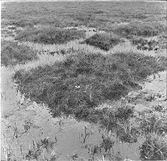
Hjejlerede i Lille Vildmose. Eksempel paa særdeles fugtig Ynglelokalitet.