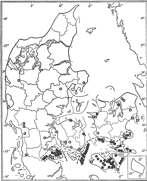
Fig. 2. Oversigt over Pirolens Ynglesteder. De sorte Prikker angiver nuværende og mere konstante Ynglepladser, Cirklerne tidligere samt mere tilfældige Ynglesteder.

men synes især at være almindelig i Skovene paa Vestsiden, nemlig omkring Gaunø, Holsteinsborg og Basnæs. Paa Østsiden er den kendt fra Præstø, og Skovene omkring Juellinge og Vemmetofte er ligeledes nogenlunde sikre Ynglesteder. I det nordlige Sjælland er der et Par Lokaliteter, hvor den har